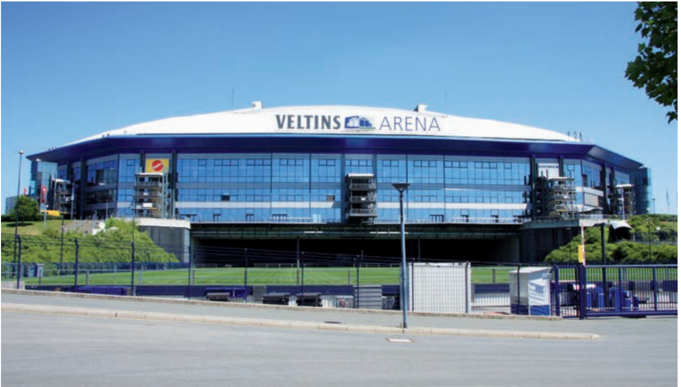
Die Veltins-Arena auf Schalke in Gelsenkirchen ist das Stadion des deutschen Fußball-Bundesligisten FC Schalke 04.

Natürlich spielen kulturelle Unterschiede in den Ländern bei der Betrachtung eine Rolle. Entscheidend für unsere Maßnahmen ist die passgenaue Zielgruppenansprache in den verschiedenen Altersgruppen. So werden wir z.B. in den kommenden Jahren noch verstärkter Jugendmarketing betreiben, denn eine kürzlich erfolgte Studie zeigt, dass sich Kinder bis spätestens zum achten Lebensjahr entscheiden, welchen Verein sie als Fan begleiten.