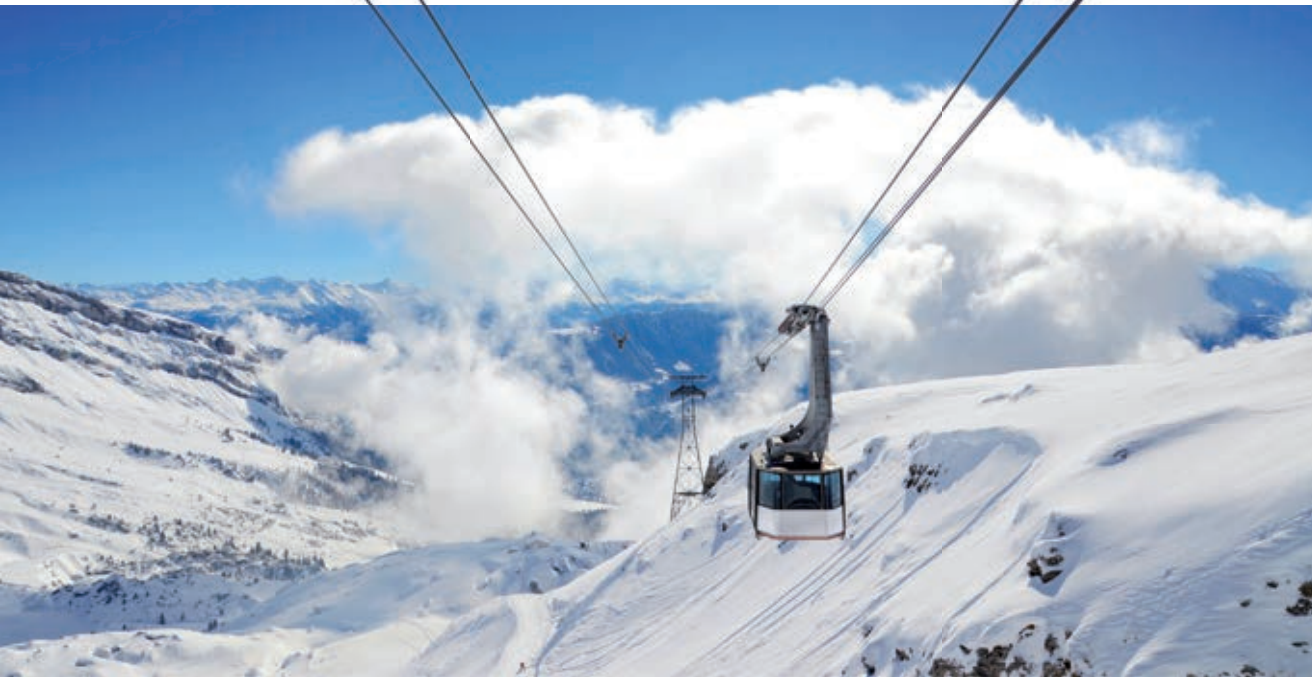
Skigebiet Flims Die Übernahme der Flimser Bergbahnen war der wichtigste Milestone für die Entstehung der Weissen Arena Gruppe.