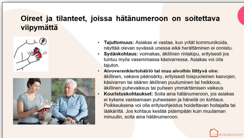
Abbildung 4: Screenshot eines Kursinhalt-Beispiels aus dem finnischen Pilot-Training (Symptome und Situationen, in denen du sofort den Notarzt rufen musst)

konkreten Arbeitsangeboten geführt. Beispielsweise zeigten sich beim finnischen MultiplikatorInnen-Event Pflegeführungskräfte einer öffentlichen Gesundheitsorganisation interessiert, die Auszubildenden künftig als Pflegeassistentinnen einzustellen. 12 Darüber hinaus haben einige der finnischen Pilot-Teilnehmerinnen aufgrund ihrer großen Begeisterung für die Pilot-Ausbildung bereits mit ihrem Krankenpflegestudium begonnen.