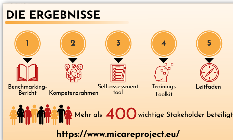
Abbildung 1: Zentrale Ergebnisse des Erasmus+ Projektes MiCare

Die Zielgruppe des Projektes sind arbeitsmarktferne Frauen mit Migrationshintergrund, die über erste Erfahrungen in der Betreuung und Pflege älterer Menschen verfügen oder die bereits ohne entsprechende Ausbildung in diesem Bereich tätig sind, sowie Frauen, die im Ausland bereits eine Ausbildung angefangen oder abgeschlossen haben. Die Migrantinnen erhielten im Rahmen des MiCare-Projektes Informationen zu den verschiedenen nationalen Einstiegsberufen in die Heimpflege sowie die Möglichkeit, über ein Assessment-Tool ihre vorhandenen Kompetenzen und ihre berufliche Erfahrung in der Altenpflege besser einschätzen zu können.