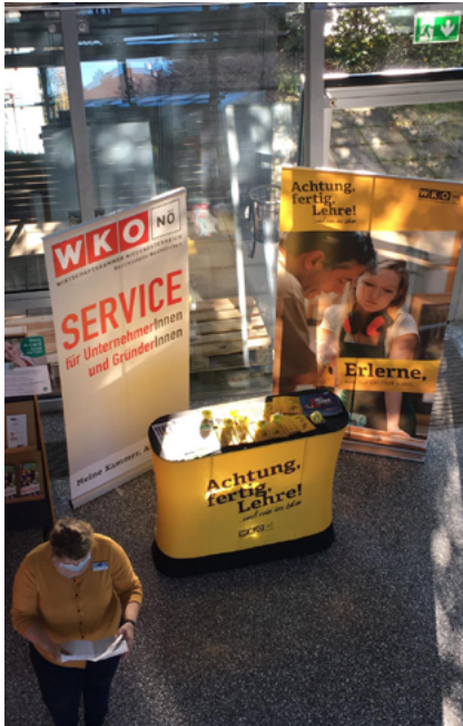
Bilder: Catrin Mayerhofer-Trajkovski