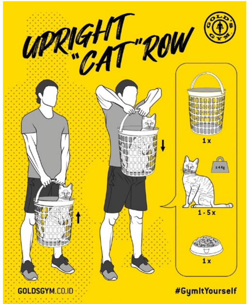
Abb. 1: Gym it Yourself, Plakatkampagne von der Fitnessstudiokette Gold's Gym

Diese auferlegten und als positiv bewerteten Verhaltensänderungen zeigen sich besonders deutlich in Konsumbereichen, in denen eine grössere Flexibilität wünschenswert ist, wie etwa bei „Arbeit & Ausbildung“ und „Einkaufen“. Doch dass neue Verhaltensweisen durch auferlegte Restriktionen entdeckt und etabliert wurden, kann in nahezu allen Bereichen des Konsums beobachtet werden. So zeigt das folgende Zitat, dass Konsument*innen durch auferlegte Restriktionen die lokale Region auch für zukünftige Urlaubsreisen und Freizeitaktivitäten entdeckt haben.