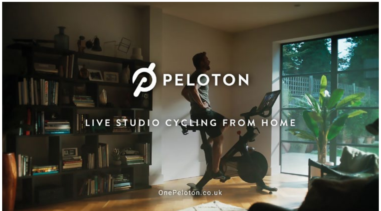
Abb. 2: Werbung von Peloton: Hersteller eines in der Covid-19-Krise stark nachgefragten digitalen Spinning-Bikes.