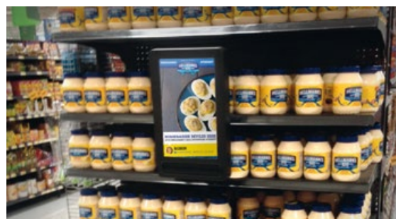
Produkt-Display mit Social Engagement in einer grossen amerikanischen Warenhauskette.