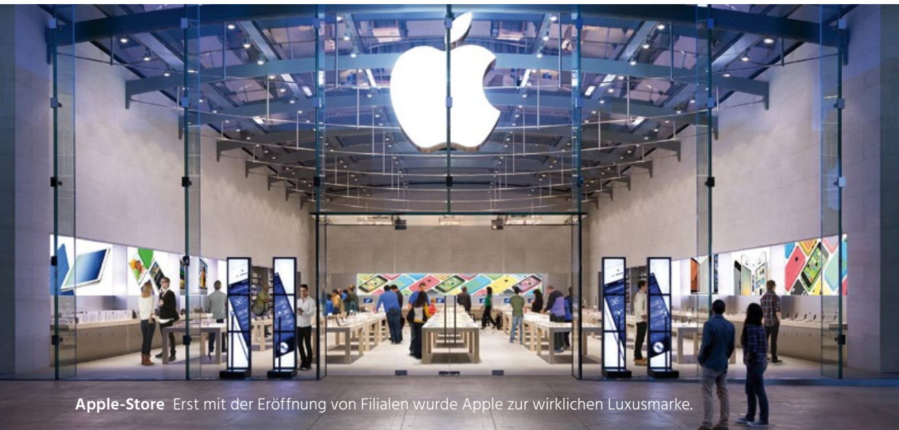
Apple-Store Erst mit der Eröffnung von Filialen wurde Apple zur wirklichen Luxusmarke.

sames Verständnis der Handlungsnotwendigkeiten. Notwendig ist das, was getan werden muss, um den Kunden zufriedenzustellen sowie die erzeugten Erwartungen und gegebenen Versprechen zuverlässig zu erfüllen. Abstimmungsprozesse und Informationsaustausch erfolgen nicht mehr in ritualisierten Meetings, sondern spontan, nach Bedarf und in kurzen täglichen Treffen, in denen hauptsächlich der Bearbeitungsstand von Aufgaben und die Einhaltung von Terminen besprochen werden. Motivation speist sich aus Teamerfolgen, vom Management entgegengebrachtem Vertrauen und erweiterten Entscheidungskompetenzen. Finanzielle Belohnungen gibt es, wenn überhaupt, nur für Teamleistung und Erfolge auf Unternehmensebene. Es gibt regelmässige Team-Retrospektiven, um Vorgehensweisen, Erfolge und Misserfolge, Probleme und gefundene Lösungen zu diskutieren und daraus gemeinsam zu lernen. Transparenz wird grossgeschrieben. Jeder weiss, was wer macht, was getan werden muss, wo man gemeinsam steht, was funktioniert und was nicht. Agilität beschreibt nicht nur eine andere Arbeitsweise, sondern ist gewissermassen eine kopernikanische Revolution im Vertrieb. Nämlich die Erkenntnis, dass sich nicht alles um das Unternehmen drehen sollte, sondern die Kunden im Mittelpunkt stehen sollten. Gerade für junge Vertriebsmitarbeiter ist ein agiles ein ideales Entwicklungsumfeld. Klingt revolutionär. Ist es für viele Vertriebsorganisationen auch.