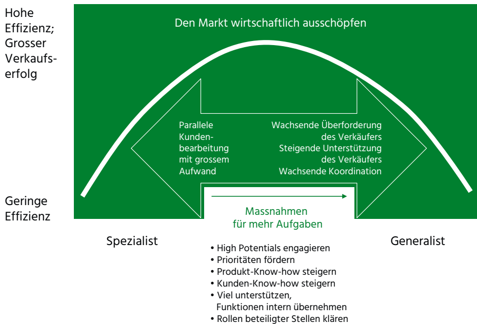
Abb. 1: Optimum der Spezialisierung im Verkauf

Wichtiger Bezug kann auch sein, was in den möglichen Gesprächen mit Kunden stattfinden soll und kann. Die konkrete Zusammenarbeit mit Kunden zeigt oft eindrücklich, was machbar und was illusionär ist.