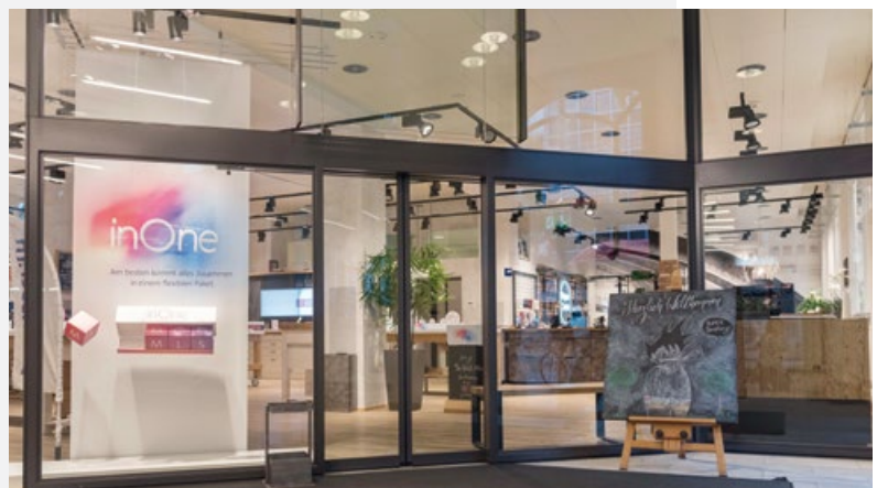
Abb. 4: Swisscom-Shop

Das Zusammenspiel zwischen den Kanälen war für den Erfolg von inOne auch zentral. So wurden bspw.