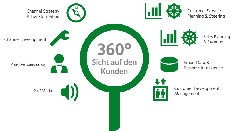
Abb. 1: Das Channel Management von Swisscom

Kunden erwarten von Swisscom persönliche Beratung und besten Service. Erst recht, wenn etwas einmal nicht so funktioniert, wie es sollte. Unterschiedliche Segmente nutzen dafür unterschiedliche Kanäle. Die wichtigsten sind die Swisscom-Shops, der telefonische Kundendienst (Hotline), der Verkauf für Geschäftskunden sowie der Online-Kanal. Während ältere Menschen tendenziell eher den Swisscom-Shop bevorzugen, setzt das Segment der „Digital Natives“ auf Online-Services. Swisscom entwickelte ab 2010 eine Multi-Channel-Strategie (je nach Definition kann diese auch als Omni-Channel-Strategie verstanden werden). Hauptziel: Den Kunden die freie Kanalwahl zu ermöglichen und eine hohe Erreichbarkeit zu garantieren. Die Strategie erwies sich im Ansatz als richtig, hatte aber auch ihre Schwächen. Zwar waren die einzelnen Kanäle inhaltlich aufeinander abgestimmt, agierten aber unabhängig voneinander. Die Touchpoints begannen, eigene Aktivitäten zu planen und zu steuern. Sie waren wie eigenständige Unternehmen im Unternehmen und lancierten sogar eigene