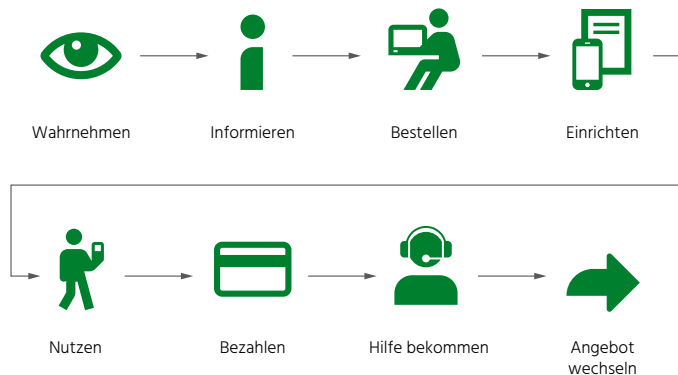
Abb. 2: Die Kundenerlebniskette bei Swisscom

In die Festlegung der Ziele fliesst auch ein, dass die Kanäle in Abhängigkeit von einem Ziel unterschiedliche Eignungen und unterschiedliche Kosten pro Zielerreichung (z.B. Kosten pro Verkaufsabschluss) aufweisen. So eignet sich bspw. der Online-Kanal hervorragend für den standardisierten Verkauf eines neuen Smartphones, während komplexe KMU-Produkte über den KMU-Account-Vertrieb oder die spezialisierte KMU-Hotline vertrieben werden müssen.