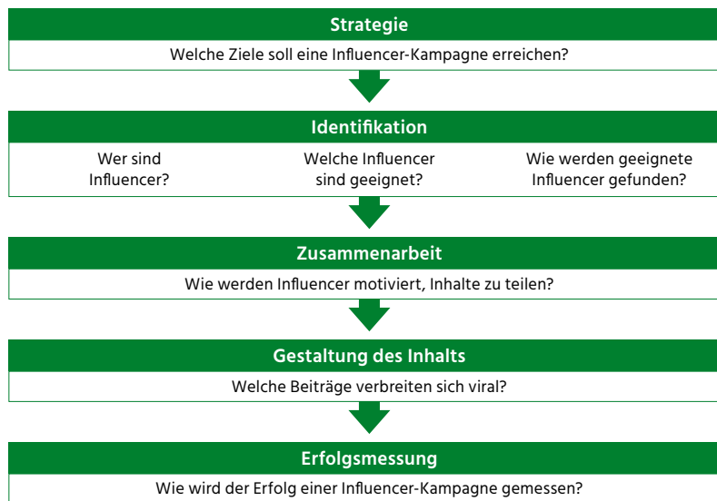
Abb. 1: Zentrale Schritte des Influencer-Marketing-Managements