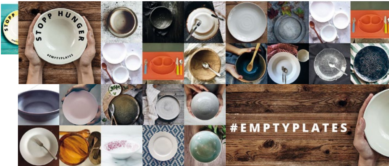
Hashtag #emptyplates Anlässlich des Welternährungstages am 16. Oktober 2017 hat UNICEF Schweiz dazu aufgerufen, einen leeren Teller via Twitter zu teilen.

den. Die Influencer können so die Marke und ihre Produkte in einem kontrollierten Rahmen testen, und man kann direkt mit ihnen kommunizieren und so allenfalls negative Reaktionen erkennen. Im Idealfall teilen die Influencer nicht nur Informationen über das