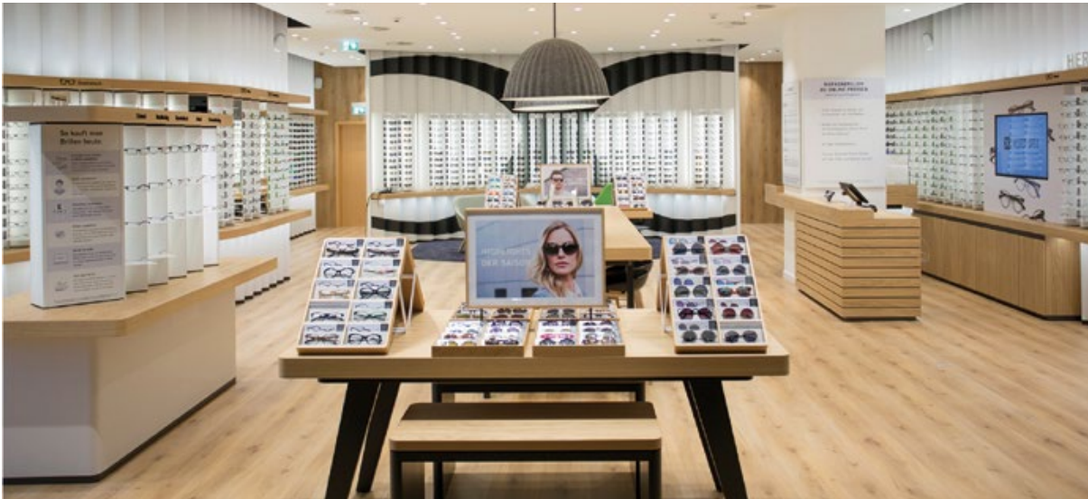
Abb. 2: Ladengestaltung bei Mister Spex im Alexa-Einkaufszentrum in Berlin