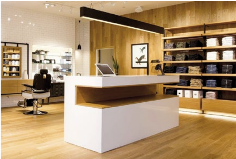
Abb. 3: Frank+Oak Boutique mit integriertem Barbierbereich in Toronto