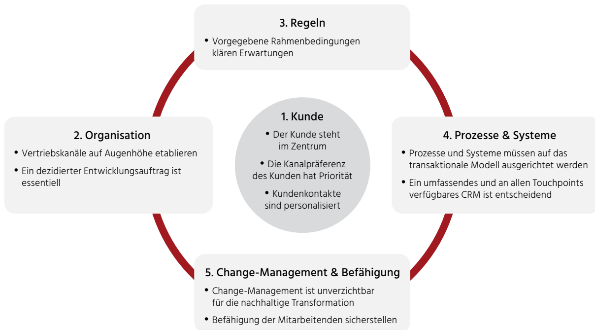
Abb. 2: Key Beliefs zur erfolgreichen Vertriebstransformation des transaktionalen Geschäfts