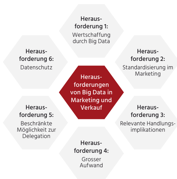
Abb. 1: Zentrale Herausforderungen von Big Data in Marketing und Verkauf

Zusammenfassend wird die Wertschaffung durch Datenqualität und Nutzungsvermögen gebremst. Wohl deshalb suchen Führungskräfte nach Bestätigung und nutzen mehrheitlich jene Informationen, die ihre Erwartungen und Absichten unterstützen und verstärken. Klar zeigten beispielsweise Hattula et al. (2015, S. 235 ff.), dass sich Marketingmanager nicht auf die Sicht des Kunden einlassen können. Werden sie aufgefordert, gleichsam empathisch die Kundenbrille aufzusetzen, verstärken sie dabei nur ihre egozentri-