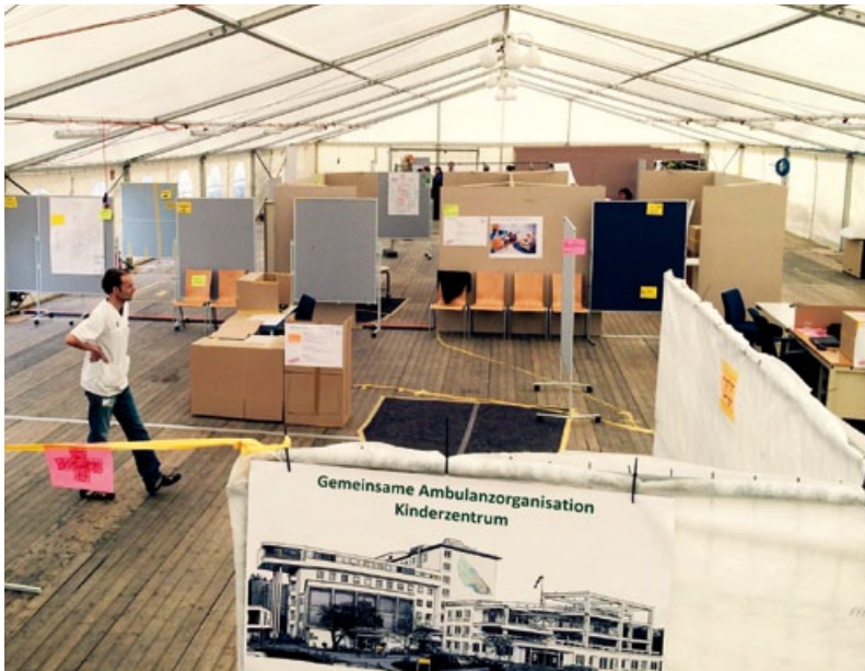
Abb. 3: Die Prototypen-Zone für die Design-Phase beinhaltet eine große Fläche und sehr mobile Infrastruktur, die innert Sekunden zu einem neuen Prototyp verändert werden konnte.