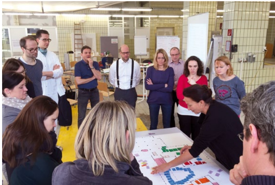
Abb. 2: Das Design-Team überprüft die technische Übersetzung ihrer haptischen Prototypen in ein Raum- und Funktionsprogramm im Rahmen einer Table-Top-Übung mit der Architektur.

Das Design-Team wurde kontinuierlich von Coaches begleitet, sodass die Patientenzentrierung immer im Fokus stand. Die Integration der unterschiedlichen Perspektiven ermöglichte eine ganzheitliche Diskussion der Lösungen. Das Design-Team konnte die unterschiedlichen Lösungsideen direkt in der Prototypen-Zone durch Patienten bzgl. Customer Delight testen lassen. Konsequenterweise war das Design-Team geschlossen an allen Gestaltungstagen anwesend und zog je nach Fokusthema Wissensträger von Spezialthemen, wie z.B. Medizincontrolling, in die Gestaltung mit ein. Die Voraussetzungen für Customer Delight werden durch ein gemeinsames Verständnis des Design-Teams geschaffen.