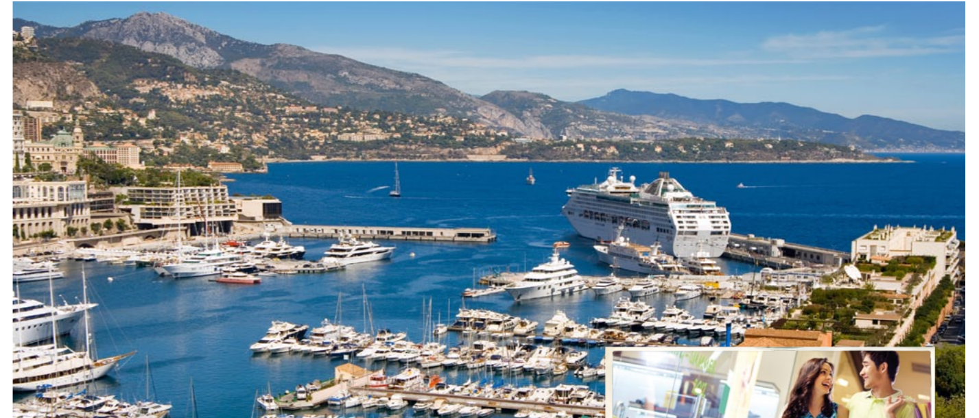
Die Luxusbereiche der heutigen Generation Das Auto zählt weiter zu den wichtigsten Luxusbereichen der jungen HNWI, es muss sich jedoch in eine komplexere Lebenswelt integrieren.

Das Lebensgefühl der „HNWI-Grandparents“ war in ihrer Jugend von Aufbruch und Rebellion geprägt. So stand die Abgrenzung von Normen und Konventionen, den Eltern und dem Establishment im Vordergrund. Die heutige junge Generation der HNWIs hingegen strebt nach Einzigartigkeit und Erfolg. Anders als die vorherigen Generationen in ihrer Jugend, möchten die jungen HNWIs heute nicht mehr mit Traditionen, z. B. dem Familienerbe, brechen, sondern auf dem Geleisteten aufbauen und dem Erfolg ihr eigenes, modernes Gesicht geben. Somit haben sie ein persönliches, klar abgestecktes und fest eingelebtes Lebensziel, wel-