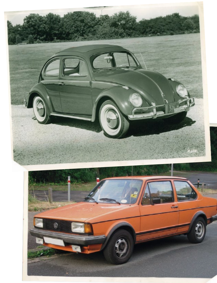
Das Lebensgefühl der „HNWI-Grandparents“ war in ihrer Jugend von Aufbruch und Rebellion geprägt. Es gab nur wenige Luxusbereiche, das Auto war einer davon.

Die Zugehörigkeit zur Gruppe der HNWI wurde auf Basis des Einkommens und Immobilienbesitzes der Elterngeneration definiert. Das jährliche (Netto)Haushaltseinkommen musste einen deutlichen sechsstelligen Betrag übersteigen, und die befragten Familien mussten eine bestimmte Mindestanzahl an Immobilien besitzen. Zur Kontrolle einer möglichen Werteverstärkung durch einen Auf-