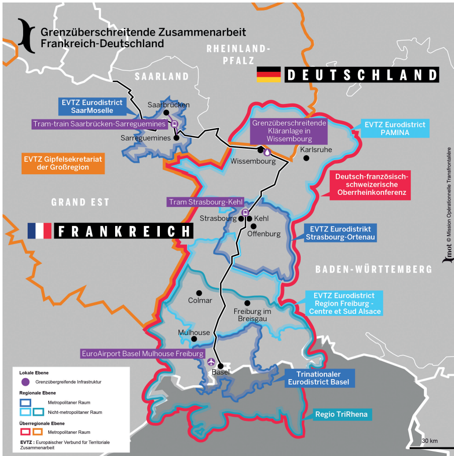
Abb. 1: Grenzüberschreitende Zusammenarbeit zwischen Frankreich und Deutschland

Seit den Bonner Verträgen aus dem Jahr 1975 ist die Grenze zwischen Frankreich und Deutschland Gegenstand einer intensiven grenzüberschreitenden Zusammenarbeit. Diese Zusammenarbeit gliedert sich in zwei Euroregionen, die im Folgenden näher untersucht werden sollen: die Oberrheinregion im Rheineinzugsgebiet und die Großregion im Einzugsgebiet von Mosel und Saar (s. Abb. 1).