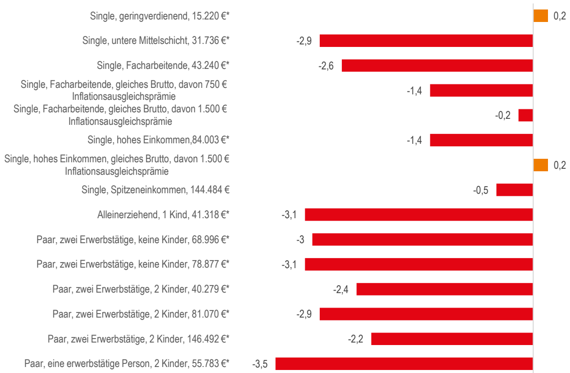
Abbildung 2: Kaufkraftlücke 2023 gegenüber 2021 für ausgewählte Haushalte, in % des Nettoeinkommens 2023

insbesondere die Energiepreispauschale aus und 2023 die stark ausgeweitete Midijobzone. Bei alleinlebenden Facharbeitenden wird der Kaufkraftverlust deutlich vermindert, wenn 750 Euro des Bruttoeinkommens in Form einer steuer- und sozialabgabenfreien Inflationsausgleichsprämie gewährt werden. Bei einer Inflationsausgleichsprämie von 1.500 Euro schrumpft die Kaufkraftlücke 2023 auf 67 Euro. Bei Alleinstehenden mit einem hohen Bruttoeinkommen (84.003 Euro) wird der Kaufkraftverlust bei Einsatz einer Inflationsausgleichsprämie von 1.500 Euro leicht überkompensiert. Alleinlebende mit Spitzeneinkommen weisen eine unterdurchschnittliche verbleibende Kaufkraftlücke auf. Sie profitieren von den Anpassungen des Steuertarifs und erhöhten Abzügen. Gleichzeitig haben sie eine vergleichsweise niedrige haushaltsspezifische Inflationsrate und werden bei einem Einkommen deutlich oberhalb der Beitragsbemessungsgrenzen unterproportional von den Beitragssatzerhöhungen der Sozialversicherungen betroffen. Die höchste verbleibende Belastung ist in der Mitte der Einkommensverteilung zu beobachten, wenn kein Anteil des Bruttoeinkommens in Form einer Inflationsausgleichsprämie gezahlt wird.