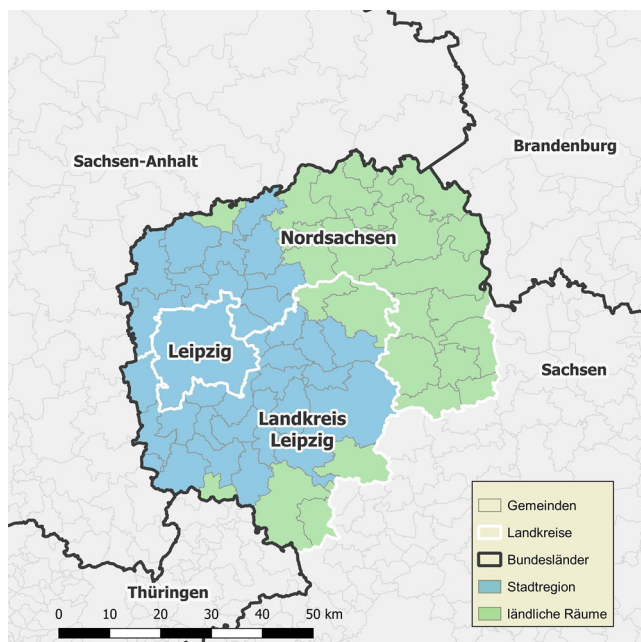
Abbildung 1 Die Planungsregion Leipzig-West Sachsen mit der Stadtregion Leipzig und ländlichen Räumen

Handlungsfeld Siedlungsflächenentwicklung operationalisiert und für die Analyse eines laufenden Prozesses in der Stadtregion Leipzig genutzt. Dies dient der Bearbeitung der Forschungsfrage, wie eine kooperative Steuerung der Siedlungsflächenentwicklung in Stadtregionen ausgestaltet werden sollte.