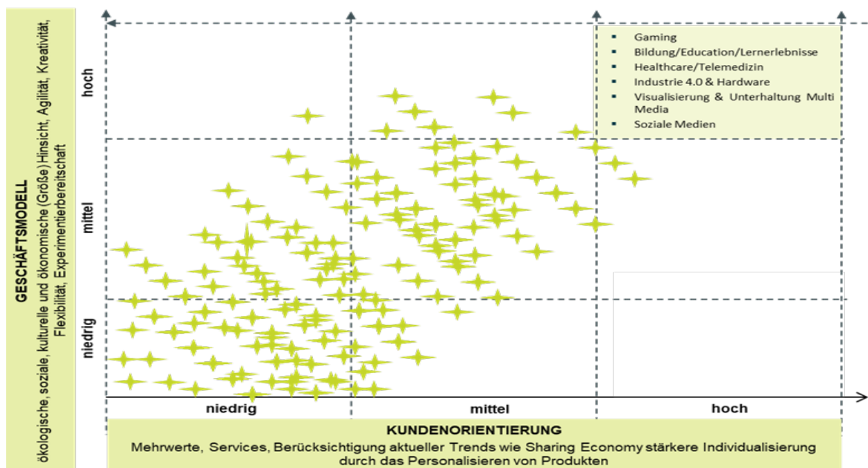
Abbildung 3: Auswertung Unternehmen, Anderie & Höinig, 2023.

Zur Auswertung der Unternehmen wurde ein Scoring-Modell mit 18 Parametern angewendet. Die Einwertung der Geschäftsmodelle erfolgte nach ökologischer, sozialer, kultureller und ökonomischer (Größe) Hinsicht, Agilität, Kreativität und Flexibilität. Die Einwertung zur Kundenorientierung umfasste Services, inkrementelle Verbesserungen der bestehenden Produkte durch den Einsatz von Sensorik und künstlicher Intelligenz, Berücksichtigung aktueller Trends, Individualisierung, Digitalisierung & Vernetzung, Anzahl der Nutzer. Die Auswertung ergab nachfolgende Ergebnisse. Die Bereiche mit hohem Potenzial werden im Kapitel 3 erläutert.