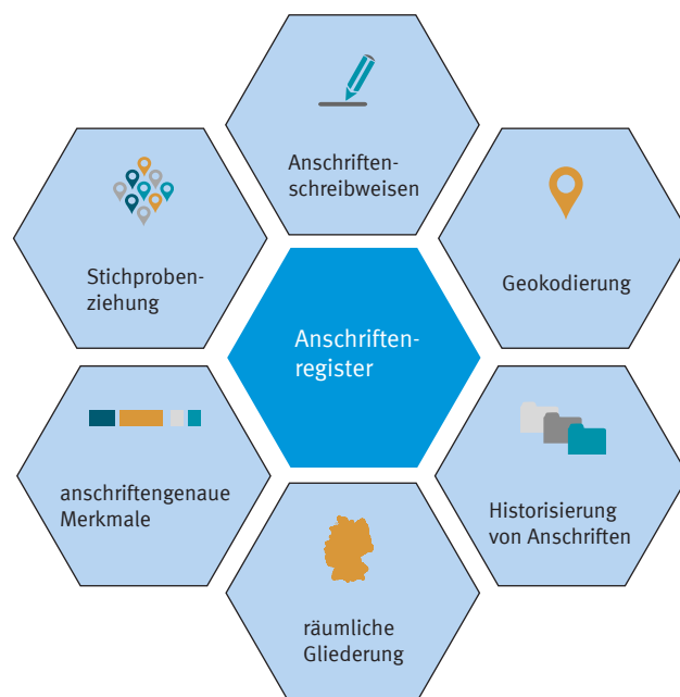
Grafik 1 Mehrwert des Anschriftenregisters für die amtliche Statistik

Das Anschriftenregister enthält alle Anschriften in Deutschland, unabhängig davon, ob diese gewerbliche, administrative oder Wohnanschriften sind. Neben klassischen Anschriftenmerkmalen wie Straße, Hausnummer, Postleitzahl und Gemeindenamen enthält das Anschriftenregister für jede Anschrift zusätzliche Informationen. Dazu zählen die geografischen Koordinaten zur Bestimmung der räumlichen Lage der Anschrift ebenso wie die Information, ob Wohnraum an der Anschrift vorhanden ist oder nicht. Das Anschriftenregister soll einen aktuel-