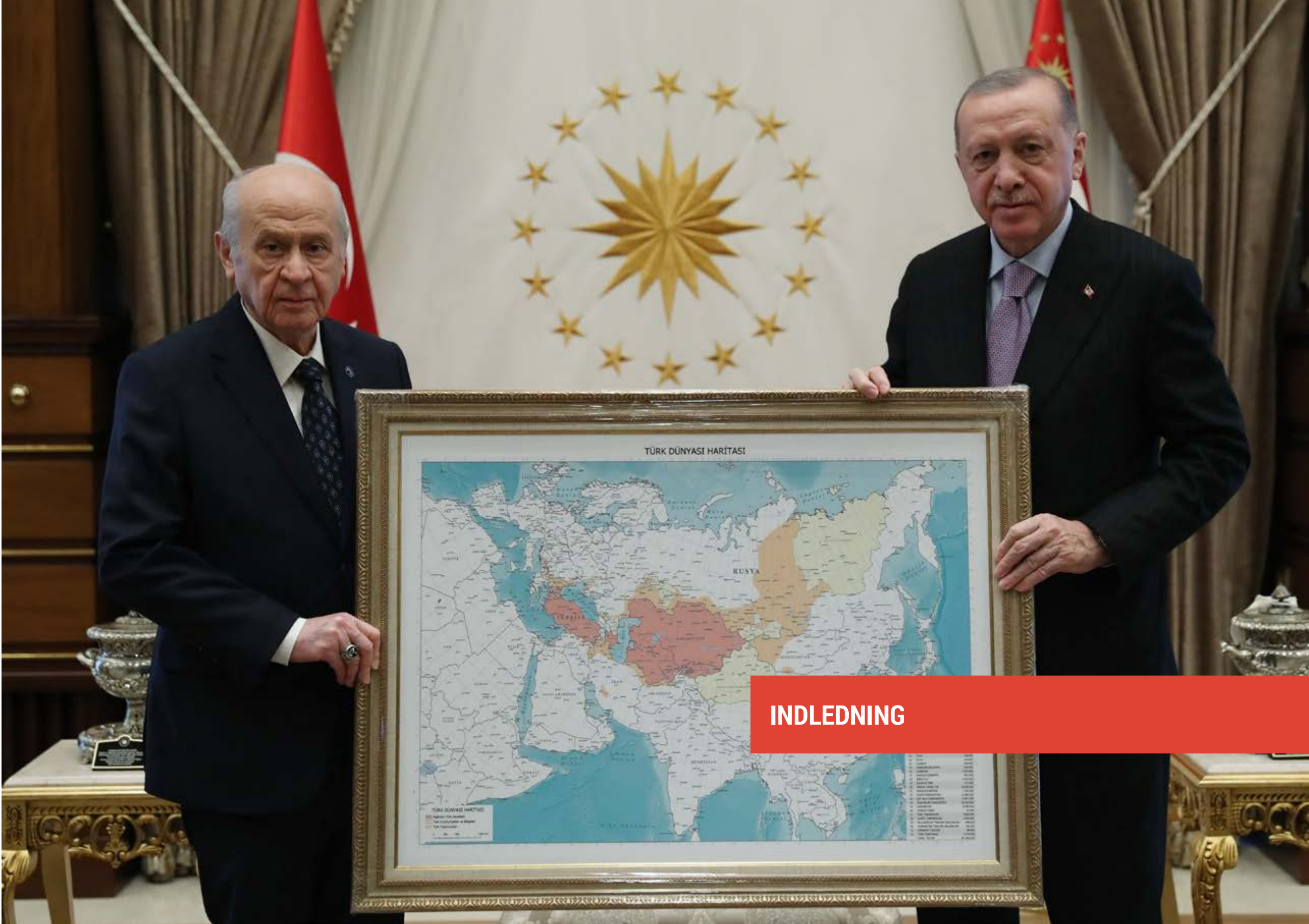
TÜRK DÜNYASI HARİTASI