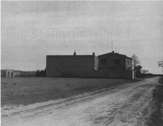
Abbildung 2 Fotografie aus Beitrag Wiepking-Jürgensmann Originalbildunterschrift: „Dieses ‚Landschafts‘-Bild aus dem schnurkeramischen Kerngebiet dokumentiert den Slaweneinbruch in geschichtlicher Zeit in tragischer Weise. Ein reicher ‚Bauer‘ auf bestem Boden!! Völlig devastierte Landschaft, die Gefahr läuft, restlos zu versteppen! Hier muss raschestens eingegriffen werden – sonst geht auch der fruchtreiche Acker verloren.“

tureller Einflüsse und als „krank“ charakterisierter sozialer Entwicklungen zwischen dem „Altreich“ und den besetzten Gebieten nicht mehr unterschieden.