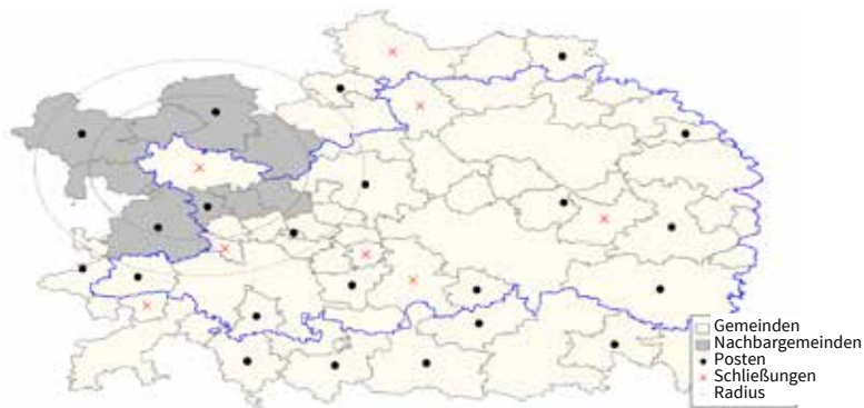
Abb. 2 Postenschließungen im lokalen Kontext