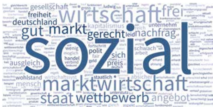
Abb. 1 Häufigkeit a erster Gedanken zum Thema Soziale Marktwirtschaft

a Die Befragten wurden gefragt: »Wenn Sie »Soziale Marktwirtschaft« hören, was sind Ihre ersten Gedanken?«. Geantwortet haben alle Teilnehmenden (N = 2 000).