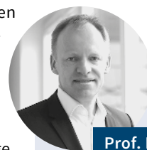
Prof. Dr. Dr. h.c. Clemens Fuest

Die Folgen der Gasverknappung aufgrund sinkender Lieferungen aus Russland sind derzeit deutlich sichtbar, auch wenn entfallende Importe aus Russland nicht der einzige Grund für die stark steigenden Gaspreise in Europa sind. Die hohe Nachfrage wegen der kräftigen Erholung der Weltwirtschaft im Jahr 2021 hatte die Preise bereits angetrieben. Die Gaspreise haben nicht nur Folgen für die Gasverbraucher, sie beeinflussen darüber hinaus den