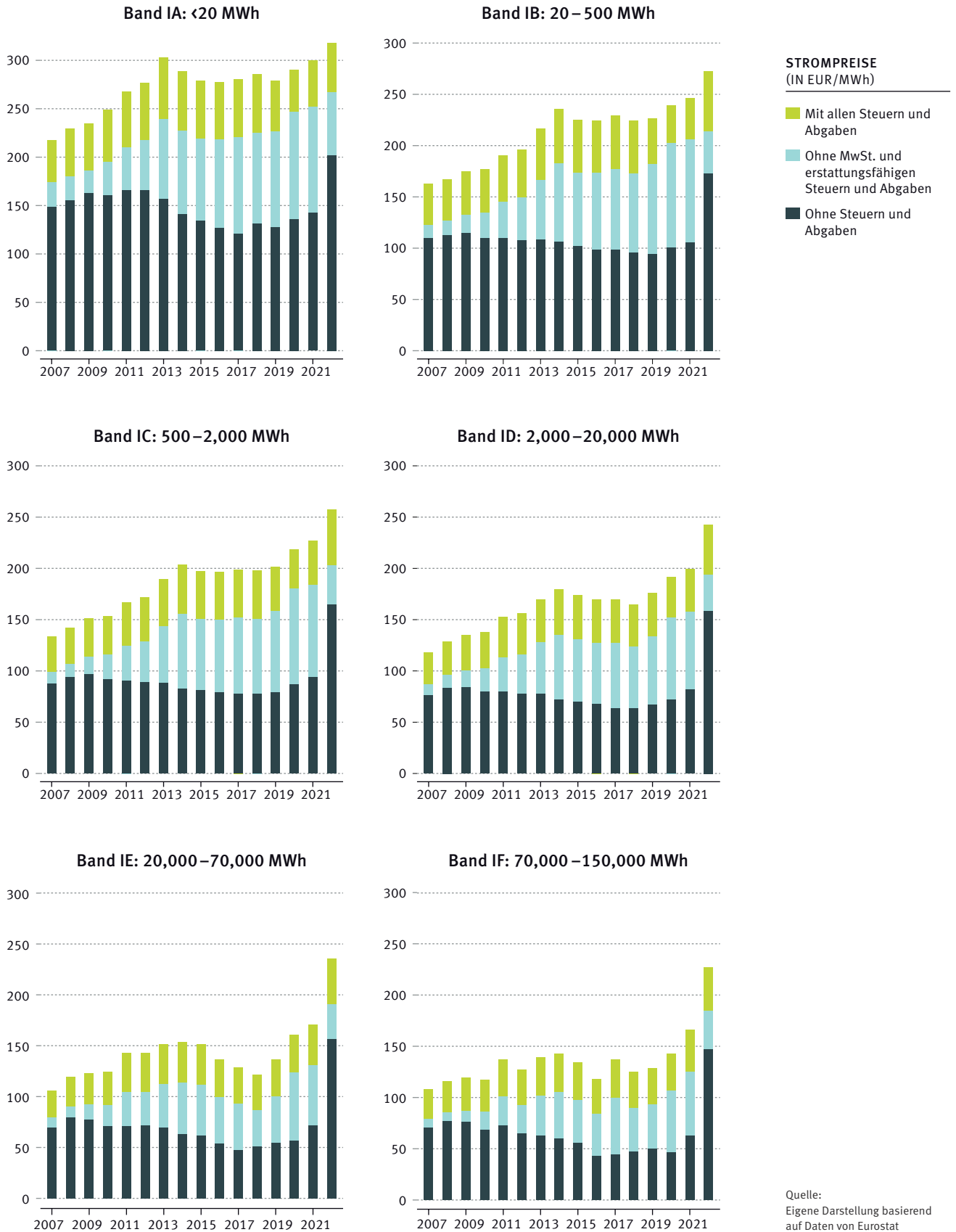
ABBILDUNG 1: STROMPREISE FÜR UNTERSCHIEDLICHE VERBRAUCHSBÄNDER, INDUSTRIEKUNDEN, EUROSTAT