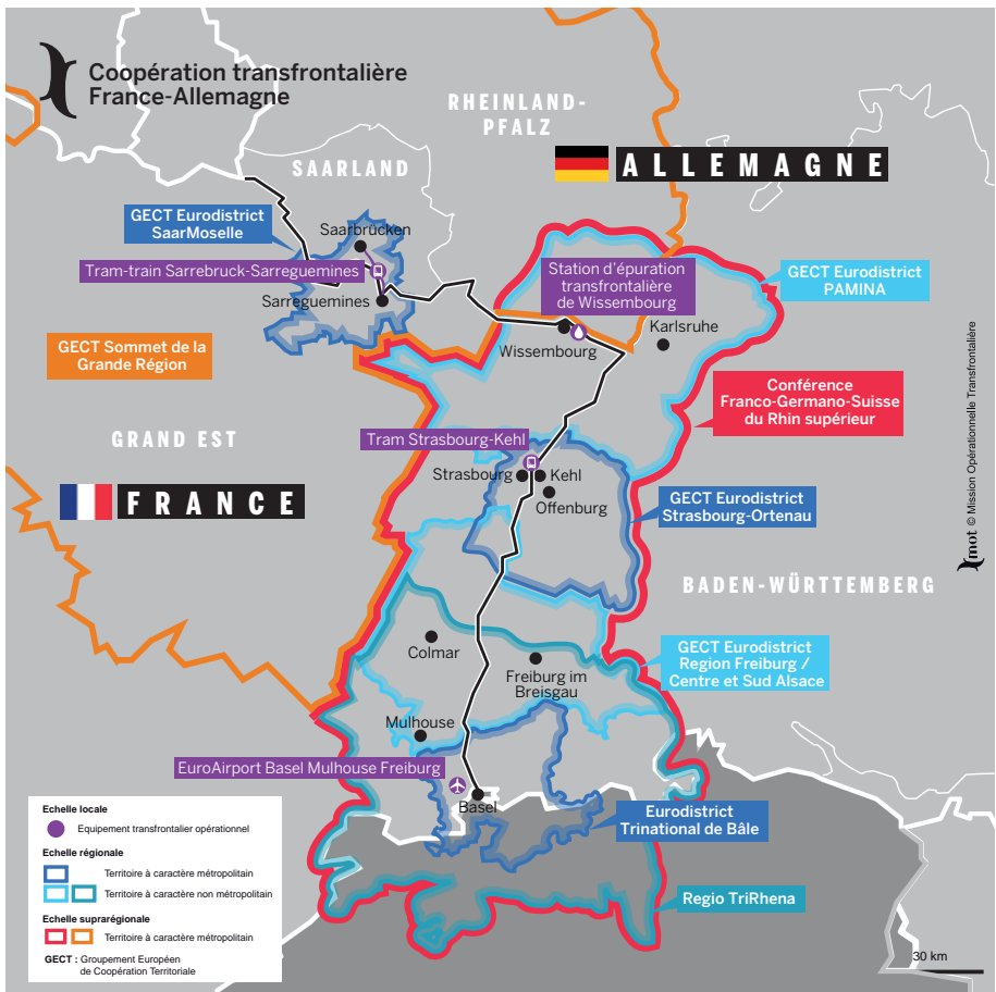
Figure 1 : Coopération transfrontalière entre la France et l'Allemagne / Source : Mission opérationnelle transfrontalière, http://www.espaces-transfrontaliers.org , (09.12.2021)

Depuis l'Accord intergouvernemental de Bonn de 1975 ( Deutsch-französische Konsultationen ), la frontière entre la France et l'Allemagne fait l'objet d'une coopération transfrontalière intensive. Cette coopération s'articule autour de deux Eurorégions qui seront analysées plus en détail : la région du Rhin supérieur dans le bassin du Rhin et la Grande Région dans le bassin formé par la Moselle et la Sarre (cf. figure 1).