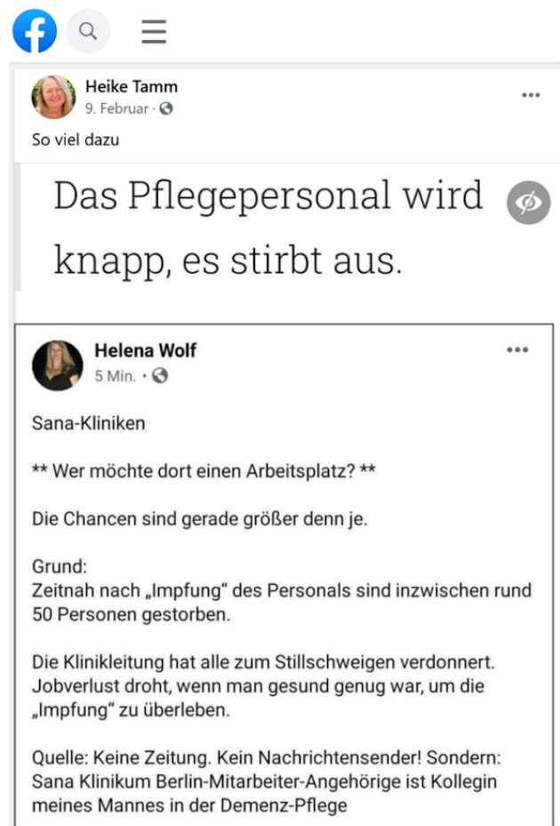
Abbildung 3: Beispiel für einen „Fake“.

schluss an den jeweiligen Themenblock abgefragt wird. Damit geht einher, dass die Antworten auf unterschiedlichen Skalen gegeben werden. Um