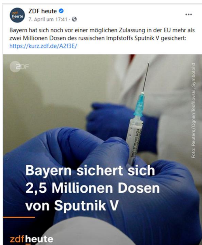
Abbildung 2: Beispiel für einen „Fakt“

Wir untersuchen drei Aspekte: die Glaubwürdigkeit von Fakes und Fakten, das Faktenwissen zu den behandelten Themen und die Einstellung zur Corona-Impfung und zu Nahrungsergänzungsmitteln (die Fakes zum Thema Ernährung befürworten den Konsum von unnötigen Protein- und Vitaminpräparaten). Ziel ist es, die gesamte Wirkungskette analysieren zu können: Verringern die Interventionen die wahrgenommene Glaubwürdigkeit von Fakes (aber nicht von Fakten)? Wenn