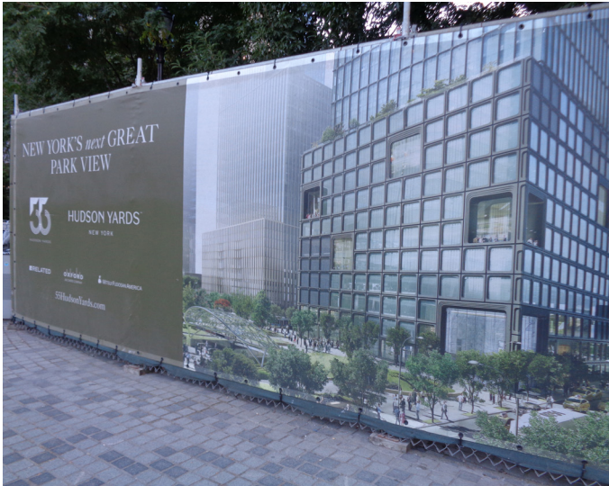
Abb. 1 Bauzaun am Stadtentwicklungsprojekt Hudson Yards in New York