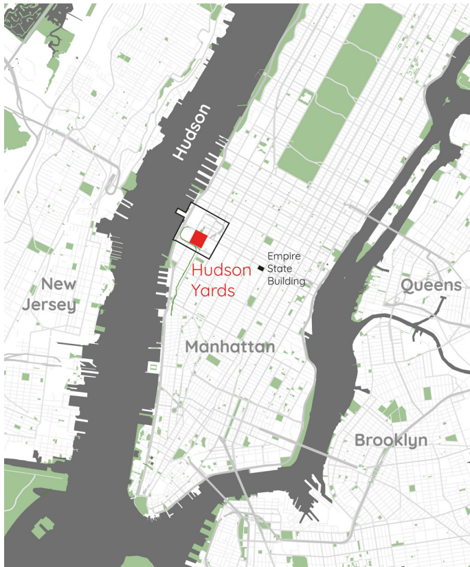
Abb. 3 Lage von Hudson Yards in New York

Hudson Yards im Westteil von Manhattan (Abb. 3) wurde als das aktuell größte, dichteste und mit circa 25 Milliarden US-Dollar teuerste Stadtentwicklungsprojekt der USA geplant (Tyler/Bendix 2019). Die erste Bauphase ist inzwischen fertiggestellt, wobei mit Blick auf das Projekt von der „letzten Grenze“ der Stadtentwicklung Manhattans gesprochen wird (Halle/Tiso 2014: 1; Übers. d. A.). Das neue Quartier liegt prominent am nördlichen Ende des Highline-Parks, einer der meistbesuchten touris-