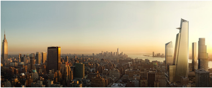
Abb. 9 Rendering der ikonischen Gebäude Hudson Yards 10&30 mit ersten Nachbargebäuden

„[...] and so our role is often to like take all the design elements from the different people or different design groups and then bring it together into images that synthesize them together [...].“ [DC 00:03:09]