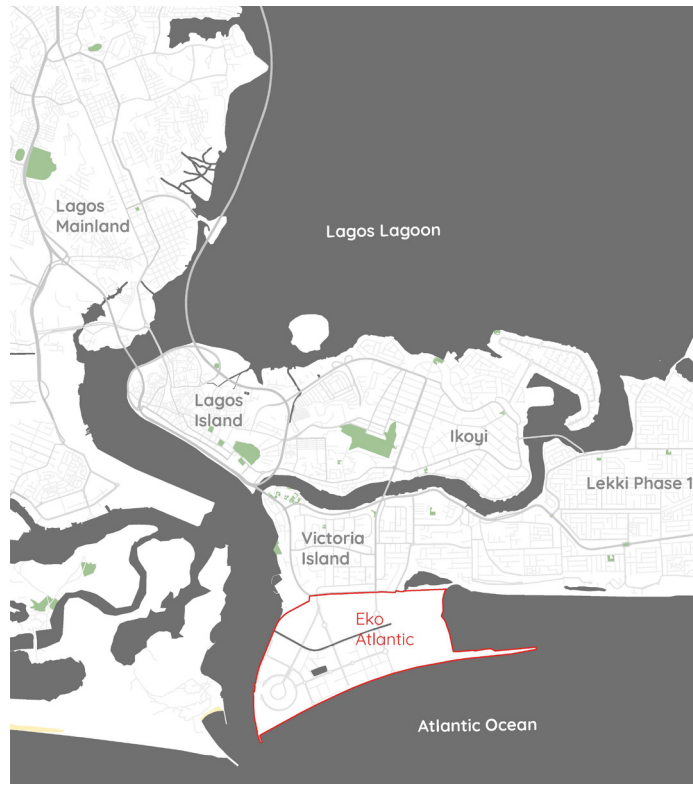
Abb. 2 Lage von Eko Atlantic vor Lagos Atlantic vor Lagos

Eko Atlantic wird vorrangig privatwirtschaftlich entwickelt und durch internationale Firmen- und Beziehungsnetzwerke unterstützt. So besuchte der frühere US-Präsident Bill Clinton als Vertreter der Clinton Foundation bereits 2013 das eigens aufgeschüttete Land. Das Projekt wurde im Jahr 2015 bei wichtigen globalen und europäischen Immobilienmessen, dem Marché International des Professionnels de l'immobilier (MIPIM) in Frankreich und der EXPO REAL in München präsentiert, um internationale Investitionen einzuwerben. Nach dem Bau einer „Great Wall of Lagos“ getauften Staumauer durch eine chinesische Baufirma ab 2009 sollte im Atlantik, direkt vor dem heutigen Finanz- und Wirtschaftszentrum Victoria Island, ab 2011 eine 10 Quadratkilometer große Stadt gebaut werden. Ein beliebter Strand sowie einige Anwohner*innen mussten ihr bereits weichen, der Fortschritt scheint jedoch ins Stocken geraten zu sein. Die Entwicklungsfirma wirbt offensiv mit der Unabhängigkeit der neuen Stadt von den dringend verbesserungsbedürftigen Transport-, Versorgungs- und Infrastruktureinrichtungen der Millionenmetropole Lagos. Gleichzeitig pflegen die Investor*innen ein gutes Verhältnis zu den lokalen Behörden und versprechen der Stadtgesellschaft wahlweise ein „Manhattan in Westafrika“ (Eko Atlantic Sales Office 2012) oder „Hongkong in Afrika“