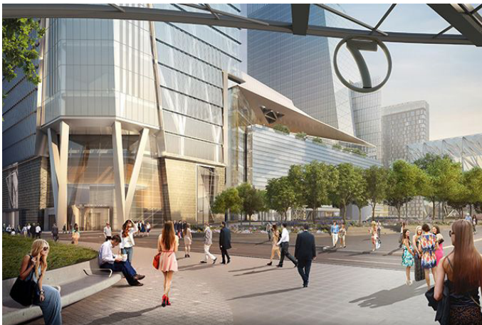
Abb. 5 Rendering der U-Bahn-Station von Hudson Yards

Die Wirkung, die eine solche Zusammenstellung (also ein Rendering) herruft, ist natürlich abhängig von den jeweiligen Betrachter*innen. Da