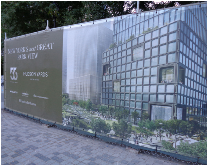
Abb. 1 Bauzaun am Stadtentwicklungsprojekt Hudson Yards in New York