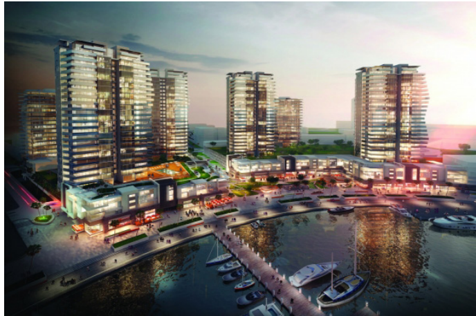
Abb. 4 Rendering der Marina von Eko Atlantic

insbesondere Menschen außerhalb der Planungs- und Architekturprofession empfinden positive emotionale Reaktionen auf solche Bilder. Neben der hohen Veränderbarkeit und den Verbreitungsmöglichkeiten von digitalen Bildern stellt dies sicher einen Grund für den häufigen Einsatz von Renderings dar.