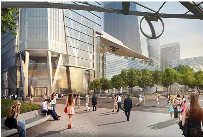
Abb. 5 Rendering der U-Bahn-Station von Hudson Yards

Die Wirkung, die eine solche Zusammenstellung (also ein Rendering) herruft, ist natürlich abhängig von den jeweiligen Betrachter*innen. Da