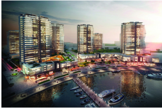
Abb. 4 Rendering der Marina von Eko Atlantic

insbesondere Menschen außerhalb der Planungs- und Architekturprofession empfinden positive emotionale Reaktionen auf solche Bilder. Neben der hohen Veränderbarkeit und den Verbreitungsmöglichkeiten von digitalen Bildern stellt dies sicher einen Grund für den häufigen Einsatz von Renderings dar.