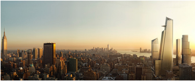
Abb. 9 Rendering der ikonischen Gebäude Hudson Yards 10&30 mit ersten Nachbargebäuden

„[...] and so our role is often to like take all the design elements from the different people or different design groups and then bring it together into images that synthesize them together [...].“ [DC 00:03:09]