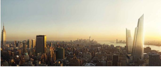
Abb. 8 Rendering der ikonischen Gebäude Hudson Yards 10&30 ohne Nachbargebäude