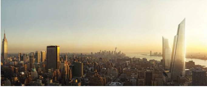
Abb. 8 Rendering der ikonischen Gebäude Hudson Yards 10&30 ohne Nachbargebäude