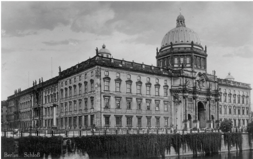
Abb. 1: (o.V. o.J.): Das Berliner Schloss in den 1920ern

Die Abbildungen zeigen das Berliner Schloss in den 1920ern und das Humboldt-Forum wie es nach Fertigstellung aussehen wird.