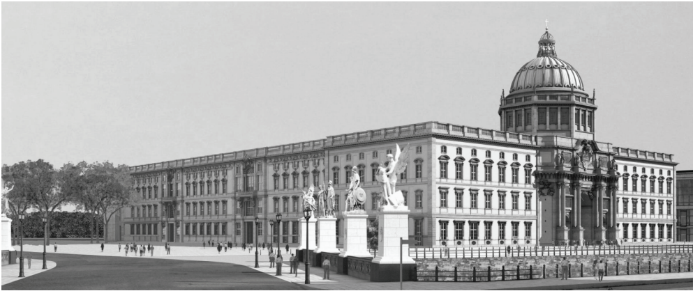
Abb. 2: Humboldt-Forum / Ansicht Nord-West Seite