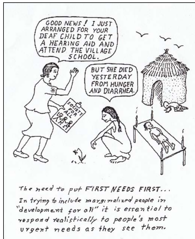
Abb.3: „First Needs First“ von David Werner

Von besonderem Interesse ist die Rolle von Selbstvertretungsorganisationen von MmB im Kontext von Entwicklungspolitik auch im Hinblick auf These II. Den Anlass für die Formulierung dieser These bot die Beobachtung, dass unterschiedliche Akteure im Feld der Entwicklungspolitik die Anliegen von MmB als Zuständigkeitsbereich darauf spezialisierter Organisationen einordneten und nach wie vor einordnen. Offensichtlich ignorieren oder vergessen sie dabei auf die Tatsache, dass die grundlegenden Bedürfnisse von MmB dieselben sind wie jene von Menschen ohne Behinderung/en. Im Handbuch für „Inclusive Planning“ von STAKES – Finnish National Research and Development Centre for Welfare and Health , wird in dem Zusammenhang von der Dringlichkeit gesprochen, primären Bedürfnissen entwicklungspolitische Priorität einzuräumen. Mit der unten stehenden, daraus entnommenen bildlichen Darstellung soll dies verdeutlicht werden.