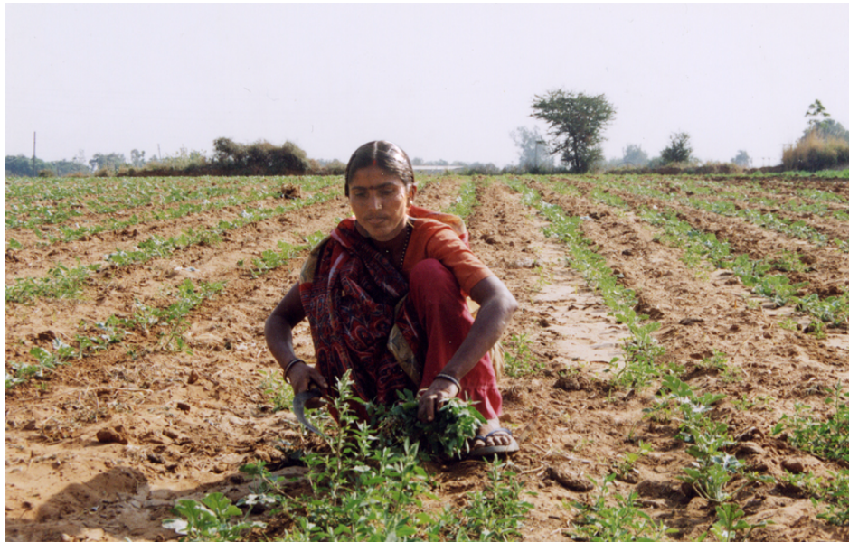
Abb. 4 Befragte beim Jäten im Feld