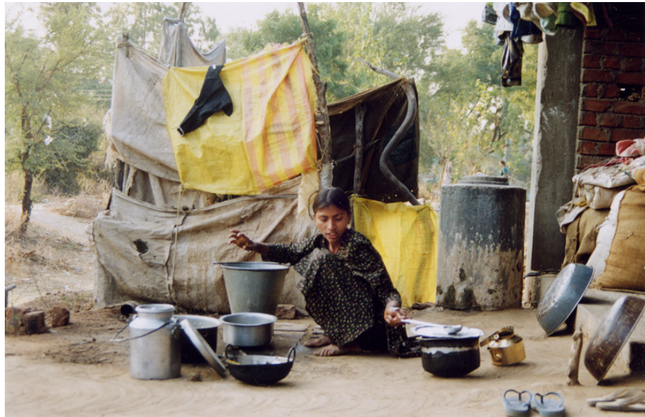
Abb. 3 Die Tochter der Befragten beim Geschirrabwaschen mit einem speziellen Waschstein. Dahinter sieht man die Dusche (ohne Wasserzufuhr).