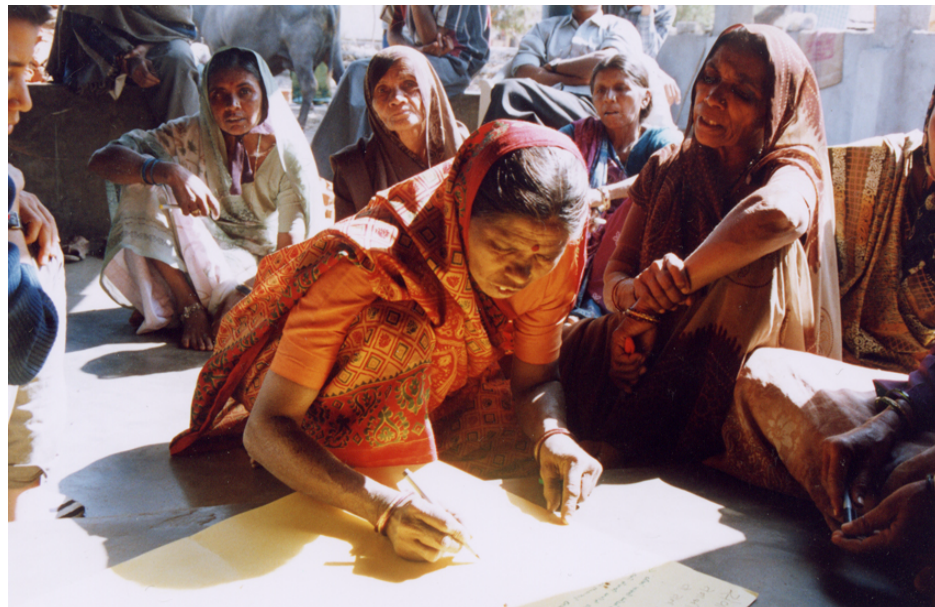
Abb. 9 Versicherungsnehmerinnen, die ein Diagramming entwerfen. Im Hintergrund einige Männer, die zu hören und einige Bemerkungen machen.