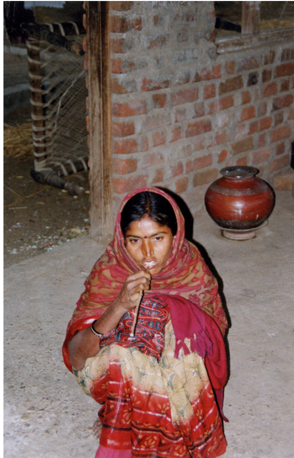
Abb.1 Befragte putzt sich mit einem desinfizierenden Holzstab die Zähne-