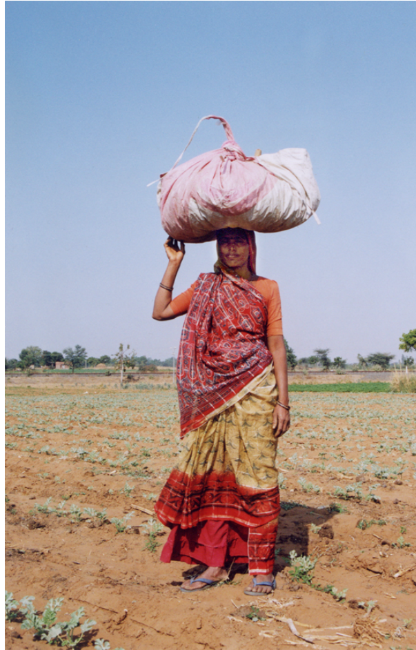
Abb. 5 Das Unkraut wird von der Befragten auf dem Kopf nach Hause getragen, dort gedörrt und an die Büffel verfüttert.