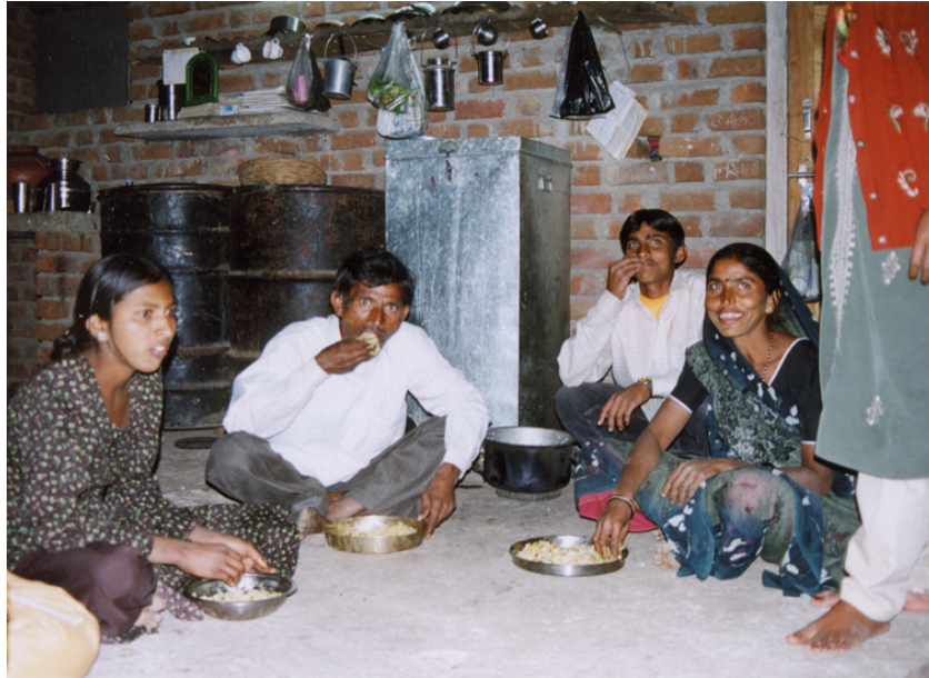
Abb. 8 Die Familie beim Abendessen in ihrem Haus, das aus einem Raum und einer Veranda besteht.