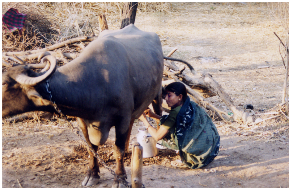
Abb. 6 Befragte beim Melken der Büffel (2 Mal täglich). Das Melken ist ausschließlich ihre Aufgabe.