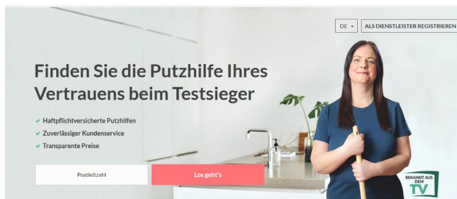
Abbildung 2: Startseite von Helpling

Auf der Website selbst wird dann deutlich, dass es sich lediglich um „[haft]pflichtversicherte Putzhilfen“ handelt (Abb. 2).