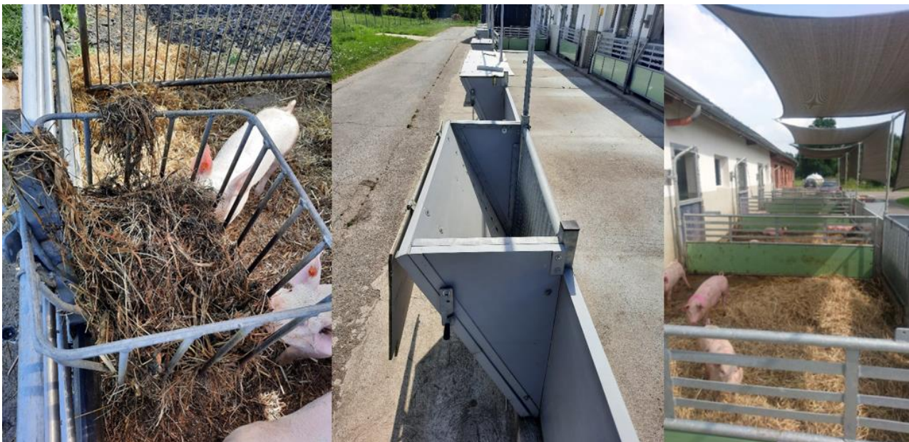
Abbildung 2: Klee grasfütterung in Trenthorst/Wulmenau

Die Kraft- und Raufuttermengen wurden täglich erfasst, das Lebendgewicht wöchentlich und schließlich Schlachtgewicht, Ausschachtung und Magerfleischanteil. Diese Daten gehen in die Leistungs-Kostenrechnung ein.