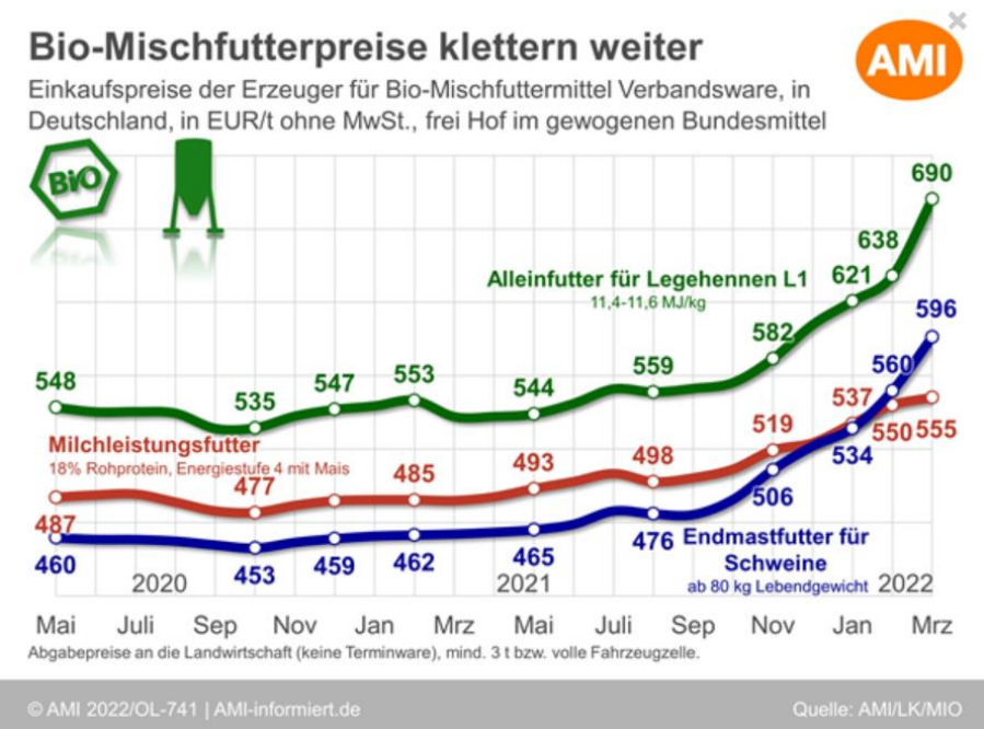
Abbildung 3: Entwicklung der Bio-Mischfutterpreise 2020–2022