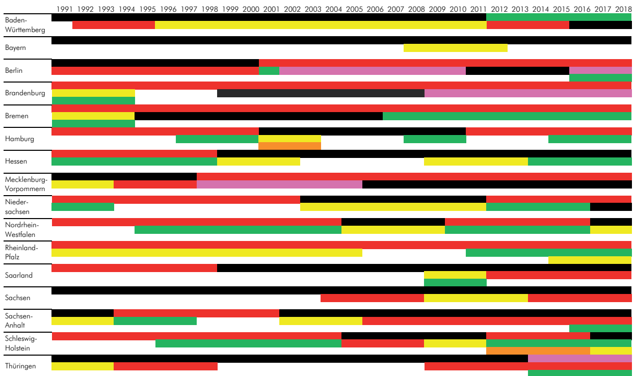
Abbildung 1 Wechsel in den Regierungskoalitionen der Bundesländer zwischen 1992 und 2018

Anmerkung: Koalitionszusammensetzung in den Bundesländern während des Untersuchungszeitraums zwischen 1992 und 2018. Der stimmenstärkste Koalitionspartner und damit die führende Partei ist jeweils in der ersten Zeile dargestellt. Die Parteien sind: CDU (schwarz), SPD (rot), Bündnis 90/Die Grünen (grün), FDP (gelb), DIE LINKE (rosa), Partei Rechtsstaatlicher Offensive (Hamburg, orange), Südschleswigscher Wählerverband (Schleswig-Holstein, orange).