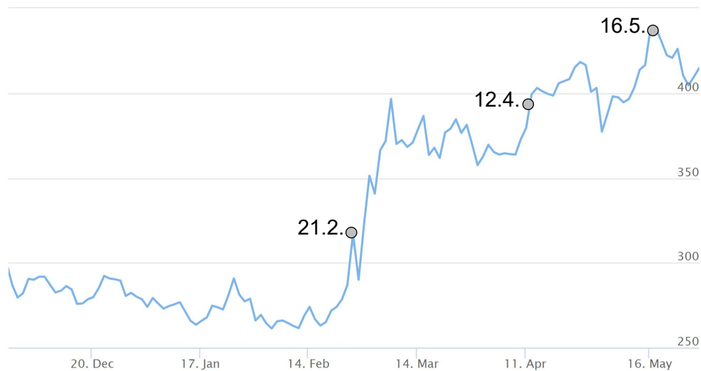
Abbildung 1: Starker Anstieg des Terminmarktpreises für Weizen

In den letzten Monaten sind die Terminmarktpreise für Weizen global stark angestiegen. Abbildung 1 gibt einen Überblick. Zugrunde liegen die Daten der Pariser Weizenbörse MATIF. Die blaue Kurve zeigt, wie Terminkontrakte für September 2022 im 6-Monatszeitraum vom 29. November 2021 bis zum 27. Mai 2022 von unter 300 Euro zunächst im Preis gesunken und dann binnen kurzer Zeit auf über 400 Euro gestiegen sind.