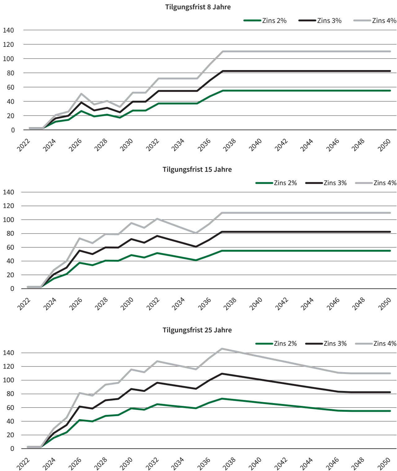
Zinszahlungen in Euro 2022-2050 in Abhängigkeit von der Tilgungsdauer der Corona-Kredite in Mill. Euro

Quelle: Berechnungen und Darstellung des ifo Instituts.