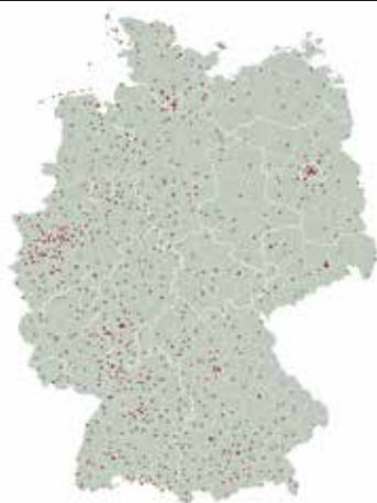
Abb. 1 Orte und Zeitpunkte von Klimastreiks im Jahr 2019