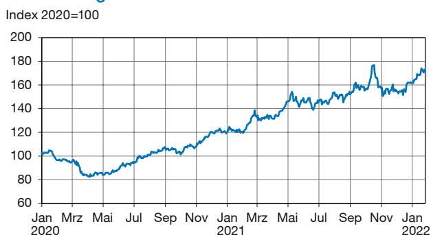
Abbildung 1 Entwicklung des HWWI-Index für Nichteisenmetalle