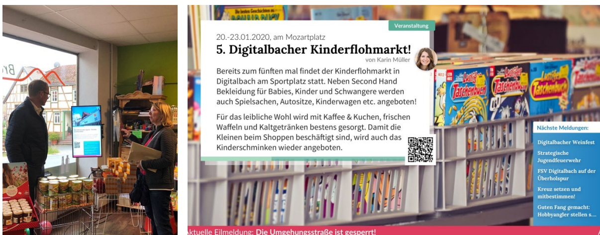
Abbildung 1: Der Digitale Schaukasten im Dorfladen Bremke und Screenshot

Ein Teil dieser Bedarfe konnte durch die Bereitstellung der bereits vorhandenen Lösungen „DorfFunk“ und „DorfPages“ der Digitale-Dörfer-Plattform 10 abgedeckt werden, die gemeinsam mit Bürger*innen anderer Gemeinden entwickelt wurden. „DorfFunk“ ist ein lokales soziales Netzwerk für mobile Endgeräte und ermöglicht spontanen Austausch sowie Hilfsangebote und -gesuche, wie z. B. Mitfahrgelegenheiten. Im Rahmen des Projektes wurde die Lösung um eine Zusagefunktion bei Veranstaltungen erweitert, um die Organisation von Freizeitaktivitäten zu vereinfachen. „DorfPages“ dient als zentrale Gemeindegewebseite, die Informationen von Vereinen und Unternehmen, der Verwaltung und Bürger*innen in einem gemeinsamen Portal bündelt. Zugleich können Informationen wie aktuelle Meldungen oder Veranstaltungshinweise aus den „DorfPages“ in den „DorfFunk“ übertragen werden, um eine höhere Sichtbarkeit der Inhalte zu erreichen.