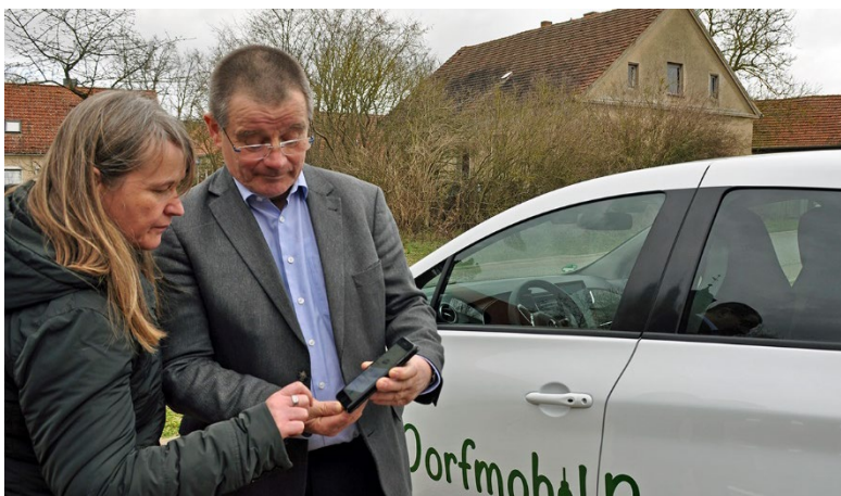
Abbildung 4: Bürger*innen beim Ausprobieren des Dorf-Carsharings

Für diejenigen ohne Smartphone oder Tablet gibt es die Möglichkeit, das Auto zu nutzen, indem ein Mitglied des Dorfvereins die Buchung übernimmt. Da dies aber vergleichsweise aufwändig ist, werden alle Dorfbewohner*innen motiviert, ein eigenes Smartphone zu nutzen. Am Standort des Autos in der Dorfmitte ist ein öffentliches WLAN eingerichtet. Dies ist nicht nur für Menschen wichtig, die keinen oder nur eingeschränkten Zugang zum mobilen Internet haben, sondern auch, weil im Dorf nicht alle Mobilfunknetze gleichermaßen abgedeckt sind. Gleichzeitig verstehen die Aktiven des Dorfvereins das