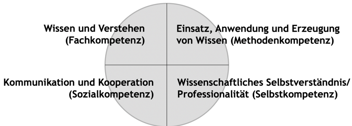
Abbildung 1: Schematische Darstellung des Hochschulqualifikationsrahmens Eigene Darstellung in Anlehnung an Kultusministerkonferenz 2017, S. 4

Der Orientierungsrahmen für die Hochschullehre in Deutschland ist der Hochschulqualifikationsrahmen (HQR) der Hochschulrektoren- und Kultusministerkonferenz (Kultusministerkonferenz 2017). Er sieht vor, dass Studierenden im Laufe des Studiums Fach-, Methoden-, Sozial- und Selbstkompetenzen vermittelt werden. Unter Fachkompetenz wird „Wissen und Verstehen“, unter Methodenkompetenz „Einsatz, Anwendung und Erzeugung von Wissen“, unter Sozialkompetenzen „Kommunikation und Kooperation“ und unter Selbstkompetenz „Wissenschaftliches Selbstverständnis/ Professionalität“ (Kultusministerkonferenz 2017, S. 4) verstanden.