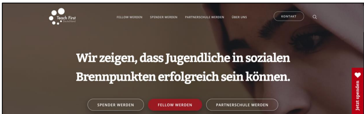
Abb. 2 Startseite von TFD