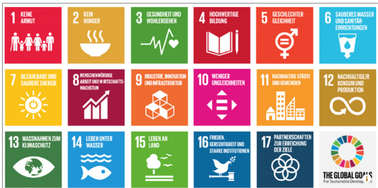
Abb. 1 Sustainable Development Goals (SDG)

Im September 2015 verabschiedeten die Vereinten Nationen die sog. Agenda 2030 für nachhaltige Entwicklung. „Die Agenda schafft die Grundlage dafür, weltweiten wirtschaftlichen Fortschritt im Einklang mit sozialer Gerechtigkeit und im Rahmen der ökologischen Grenzen der Erde zu gestalten. [...] Das Kernstück der Agenda bildet ein ehrgeiziger Katalog mit 17 Zielen für nachhaltige Entwicklung (Sustainable Development Goals, SDG). Die 17 SDGs berücksichtigen erstmals alle drei Dimensionen der Nachhaltigkeit – Soziales, Umwelt, Wirtschaft – gleichermaßen. Die 17 Ziele sind unteilbar und bedingen einander“ (BMZ 2018, vgl. auch Abb.1).