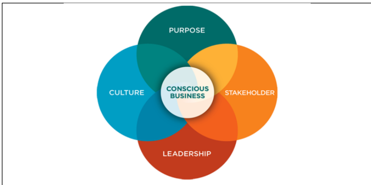
Abb. 3 Grundsätze eines Conscious Business (Quellen: Mackey/Sisodia 2014, S. 33; Consciouscapitalism.org 2018)

Diese vier Grundsätze sind im sog. „ Conscious Capitalist Credo “ von Mackey (2014, S. 273) konkretisiert. Somit wird auch die Abgrenzung zum bisher verwendeten Begriff der Corporate Social Responsibility (CSR) deutlich (vgl. Tab. 1).