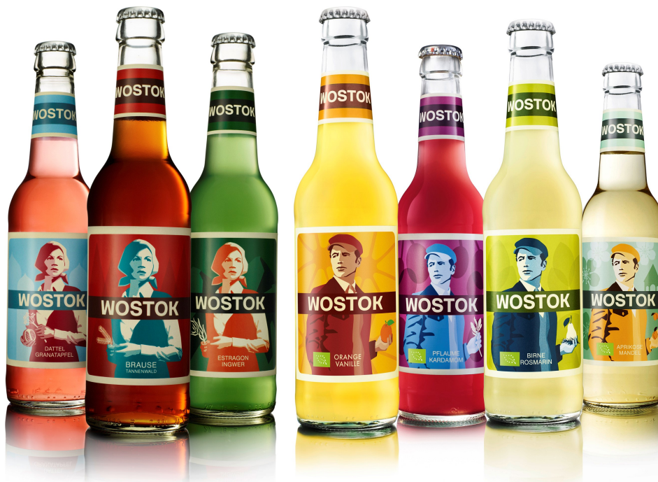
Abb. 4 Wostok-Limonaden

Ab dem Jahr 2012 folgte eine Markendehnung (Deutsches Institut für Marketing 2016), wie in Abb. 3 dargestellt. Die Sorten Dattel-Granatapfel und Estragon-Ingwer ergänzten die Produktlinie mit Zutaten aus konventionellem Anbau. Ab dem Jahr 2014 wurden auf Betreiben des Geschäftsführers der Supermarktkette BIO COMPANY Wostok-Limonaden in Bio-Qualität eingeführt (Van Velzen 2017, S. 24), erkennbar am Mann auf dem Etikett. Abb. 4 gibt einen Überblick über alle Geschmacksrichtungen, die regulär im Handel erhältlich sind.