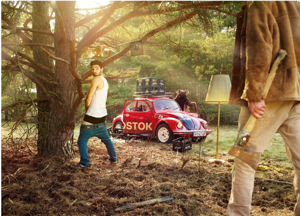
Abb. 5 Werbemotiv Wostok

Ende des Jahres 2017 hatte die Baikal Getränke GmbH 450.000,- Euro mit einer Crowdfunding-Kampagne eingenommen und wollte diese dazu nutzen, die Kommunikationsaktivitäten zu professionalisieren. Zum einen sollten weitere POS-Materialien wie z.B. Bierdeckel geschaffen werden, zum anderen sollten die Social Media-Kanäle professionell betreut werden (Baikal Getränke GmbH, 2017a). Akute Herausforderungen wie Transportengpässe im Hitzesommer 2018, von denen weite Teile der deutschen Erfrischungsgetränkeindustrie betroffen waren, führten dazu, die Professionalisierung zu verschieben (van Velzen, Interview, 12. November 2018).