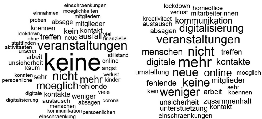
Abb. 1: Wortwolken „Stichwörter zu den prägenden Erfahrungen für die Organisation während der Corona-Krise“, links = stark betroffen, rechts = weniger stark betroffen