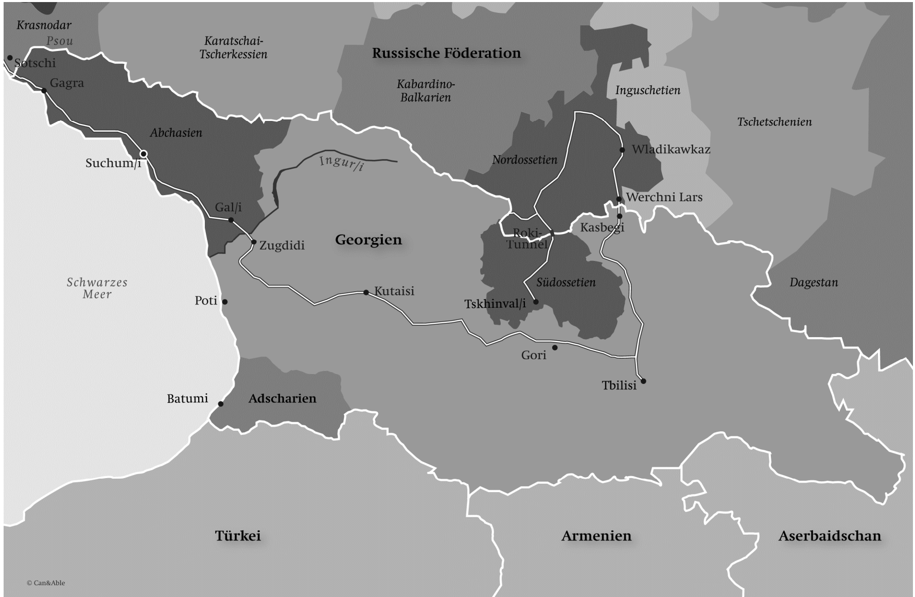
Karte 6: Georgien im regionalen Umfeld