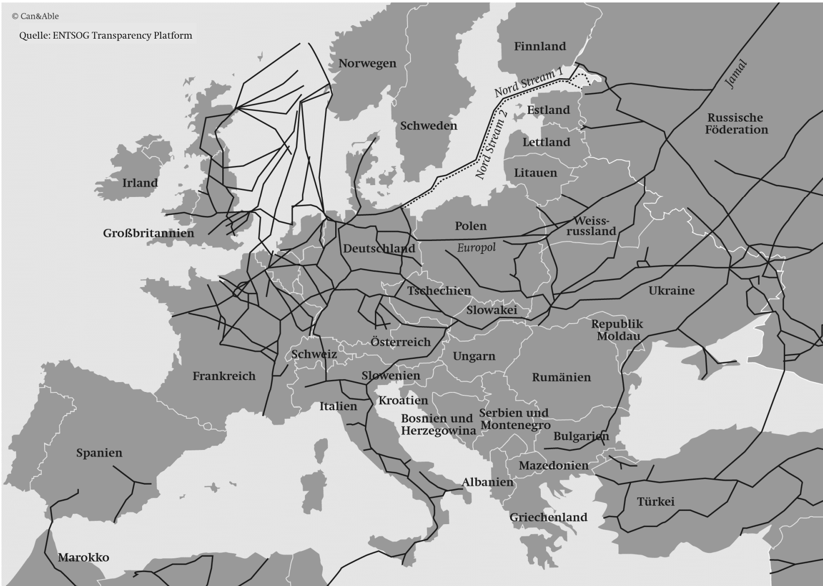
Karte 4: Europas Fernleitungsnetz