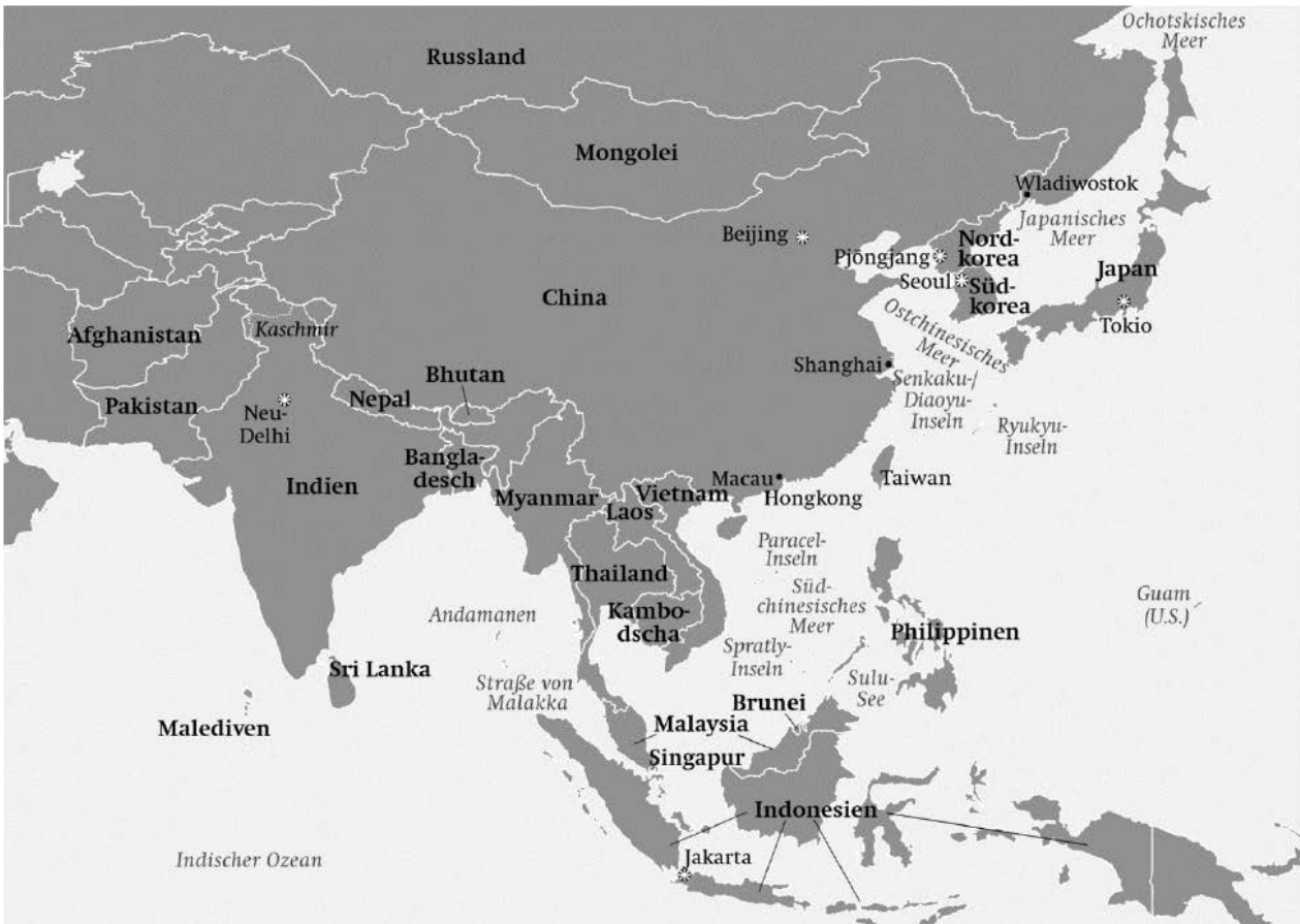
Karte 1 Asien