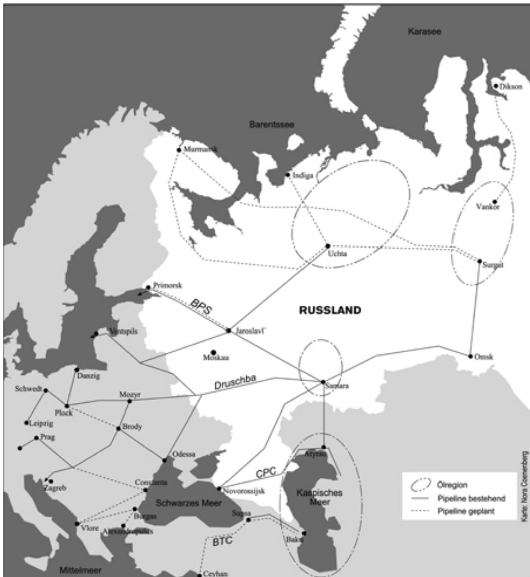
Karte 1 Russische Ölexportpipelines Richtung Westen

erspart, Butinge soll sogar seine Exportkapazität erweitern können. 8