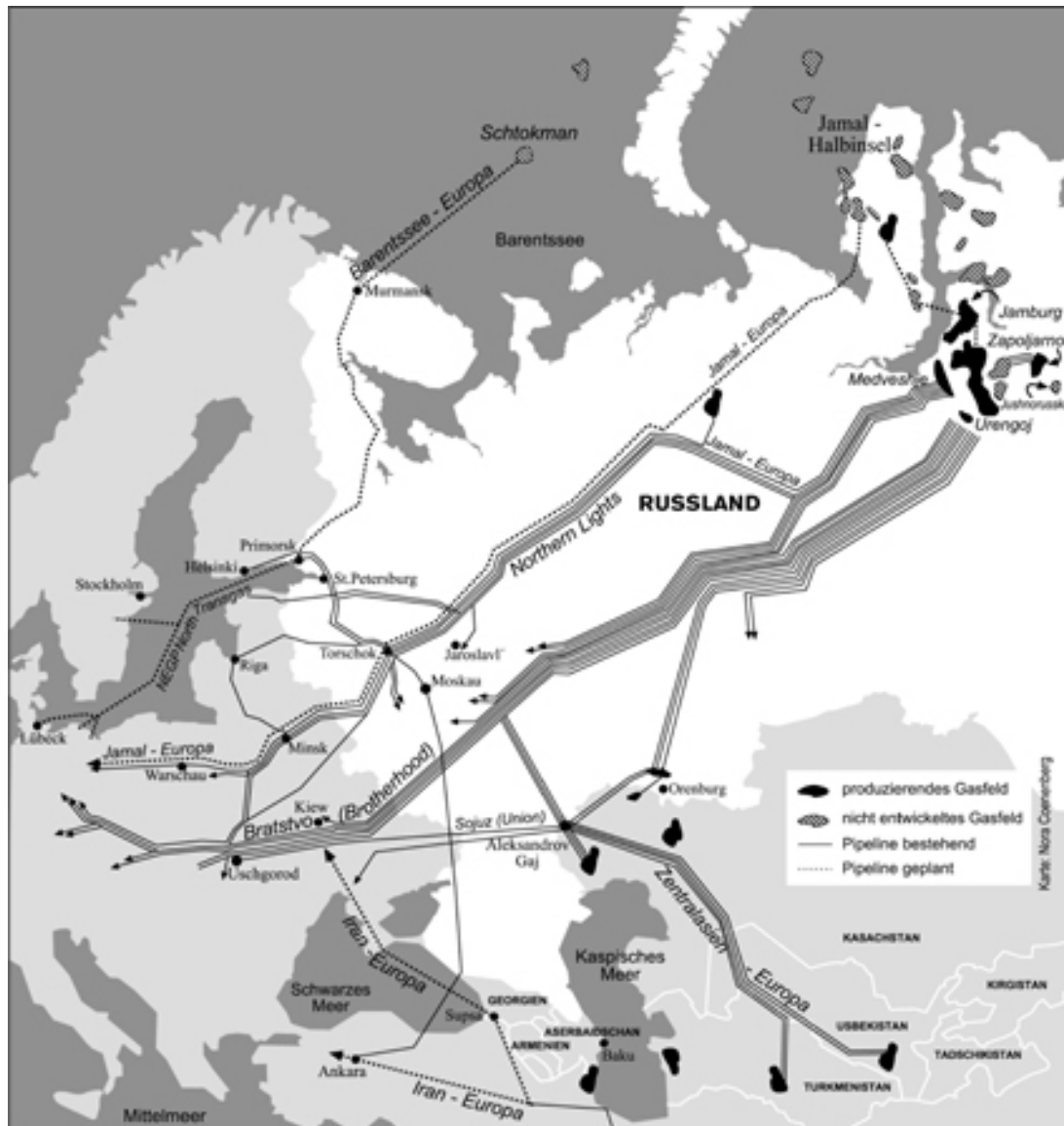
Karte 3 Russische Erdgaspipelines Richtung Westen

Putin und Premierminister Tony Blair die Absicht der Kooperation Rußlands und Großbritanniens beim Bau der Ostseepipeline bekräftigt. Anlässlich des Besuchs von Bundeskanzler Schröder am 8. Juli 2004 wurde in Moskau bekanntgegeben, daß der E.ON-Konzern mit seiner Tochtergesellschaft Ruhrgas sowie die russische Gazprom beabsichtigen, den vom russischen Vyborg bis Greifswald führenden Teil der Pipeline gemeinsam zu finanzieren. Dabei sind die Baukosten des 1200 km unter Wasser verlaufenden Teils der Pipeline mit 2,4 Mrd. Dollar mehr als doppelt so hoch wie die einer ebenso langen, über Land verlegten Leitung. Allerdings muß diese Absichtserklärung noch in eine bindende Vereinbarung überführt werden, wofür sich