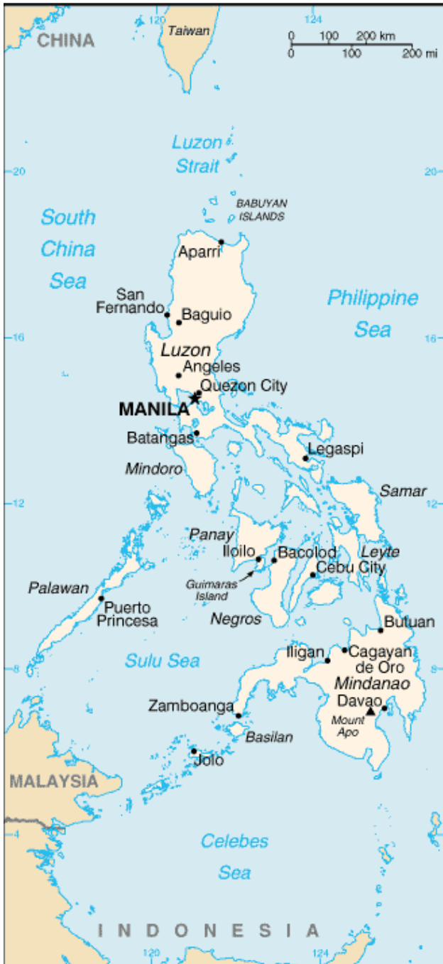
Karte 4 Die Philippinen