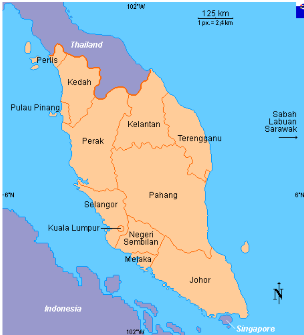
Karte 3 Die Malaiische Halbinsel

Quelle: Flags of the World, http://www.fotw.ca/misc/my(w.gif .