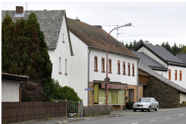
Abb. 2 Ehemaliges Lebensmittelgeschäft in Dreis-Brück

Auf Initiative des Verbandsgemeindebürgermeisters fand im April 2017 in Dreis-Brück eine zweitägige Zukunftskonferenz statt, um Probleme und Chancen zu erkennen und Maßnahmen für die Zukunft des Dorfes zu entwickeln. Die etwa 100 teilnehmenden Bewohnerinnen und Bewohner arbeiteten dabei unter anderem fehlende Treffpunkte und mangelhafte Kommunikation im Dorf als Probleme heraus. Die daraufhin gegründete Arbeitsgruppe Kommunikation wollte dies verbessern: „Wie kann man alternativ zu Treffpunkten dazu kommen, dass Leute sich wieder austauschen? Und da wir uns ja jetzt mittlerweile hier im digitalen Zeitalter befinden, war meine Idee direkt, da müssen wir irgendwas Digitales auf die Beine stellen“, erzählt ein Mitglied der Gruppe.